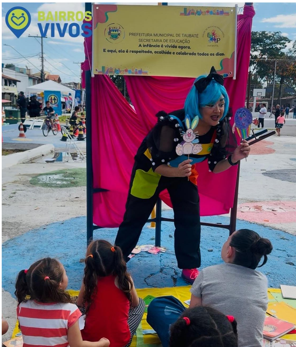
Figura 4 – Contação de história na praça, projeto Bairros Vivos.