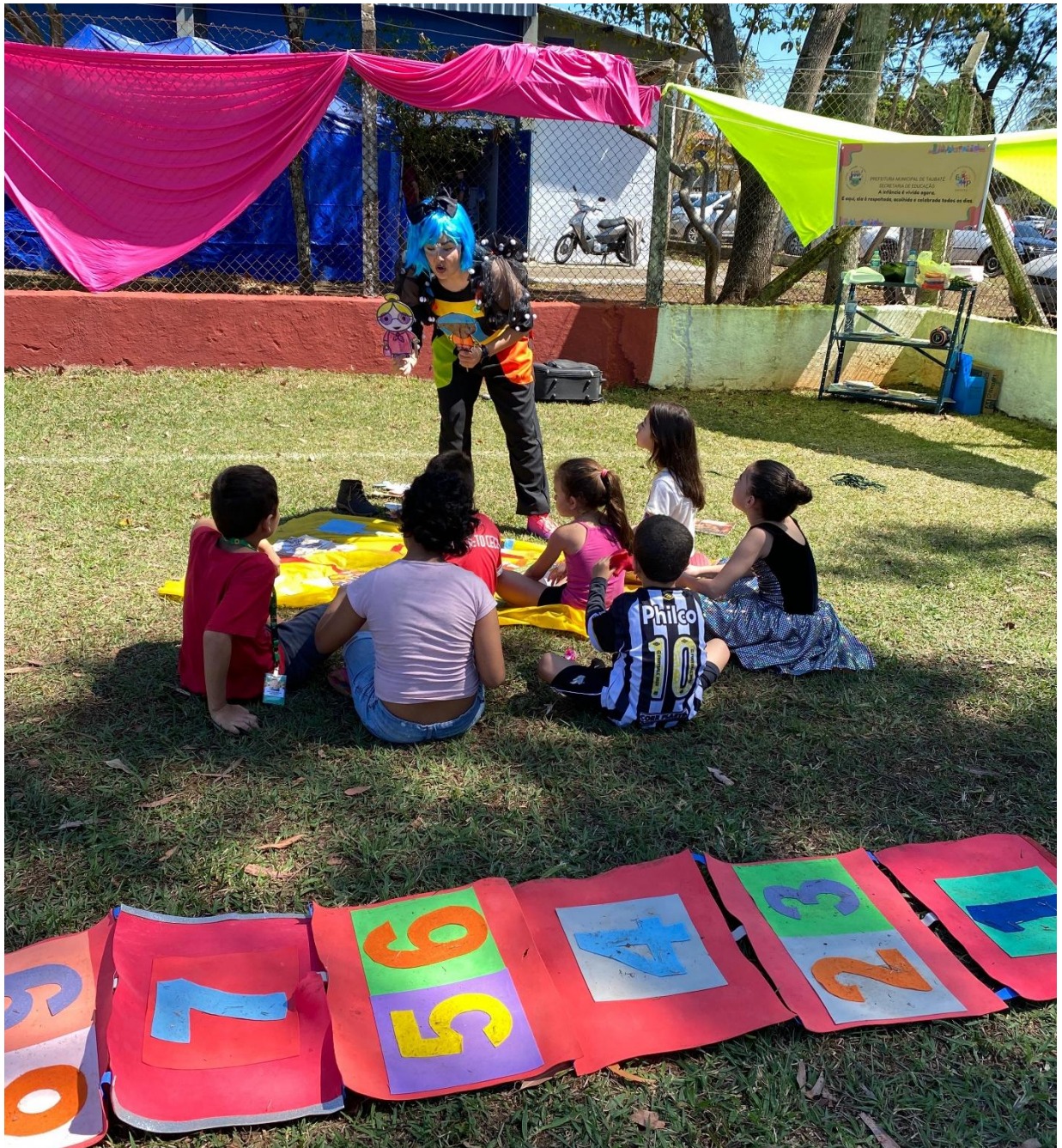
Figura 2 – Contação de história, ato 1, “O caso do bolinho”.