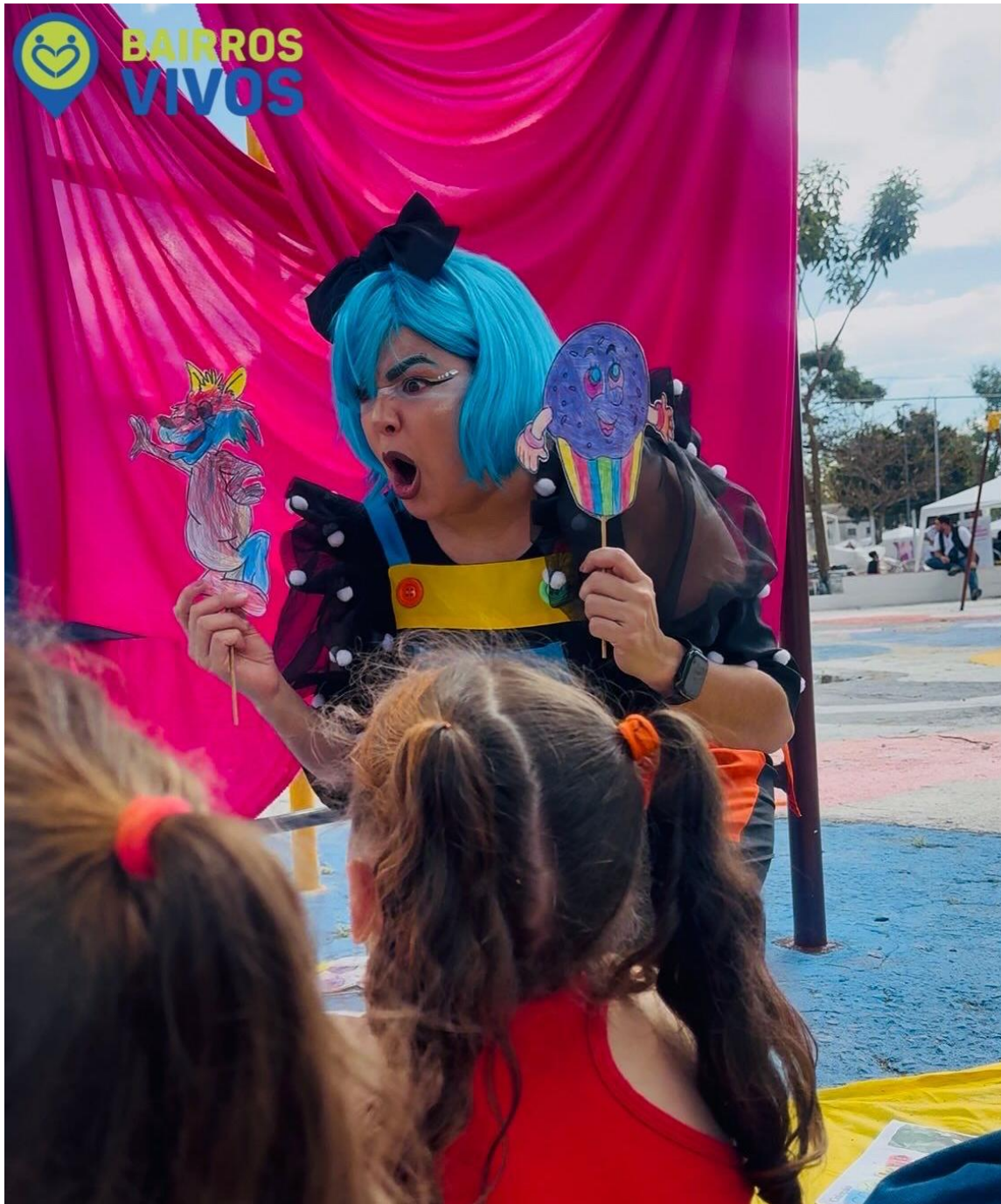
Figura 3 – Contação de história, ato 2, “O bolinho”.