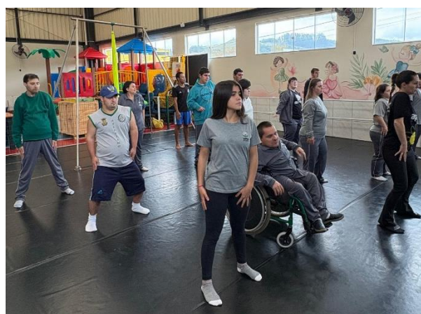
Figuras 1 e 2: Aulas de dança no ginásio APAE de São Ludgero.