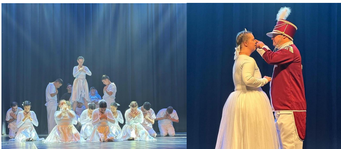
Figuras 11 e 12: 22º Unesc em Dança- Criciúma.

institucionais, programações em cidades vizinhas e eventos renomados de dança em universidades, como ocorreu em 2024 no 22º Unesc em Dança na cidade de Criciúma. Essas participações públicas reforçam a visibilidade das pessoas com deficiência enquanto protagonistas culturais, promovendo o rompimento de estigmas e o reconhecimento de suas capacidades artísticas. Segundo Santos et al. (2019, p. 274), a dança tem representatividade social, ou seja, tem sentidos e ao mesmo tempo determina e gera outros sentidos para a dança e a deficiência. Muitas pessoas com deficiência se reconhecem na dança, que tem sido uma possibilidade de se estar em sociedade. A dança pode ser um elemento de equilíbrio social para as pessoas com deficiência e/ou, possivelmente, de transformação pessoal e social.