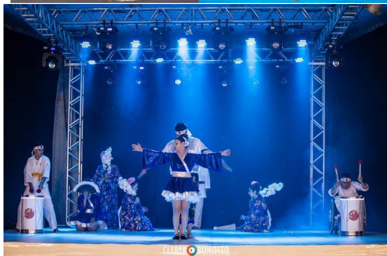
Figuras 8, 9 e 10: Festival Estadual Nossa Arte- Joinville.