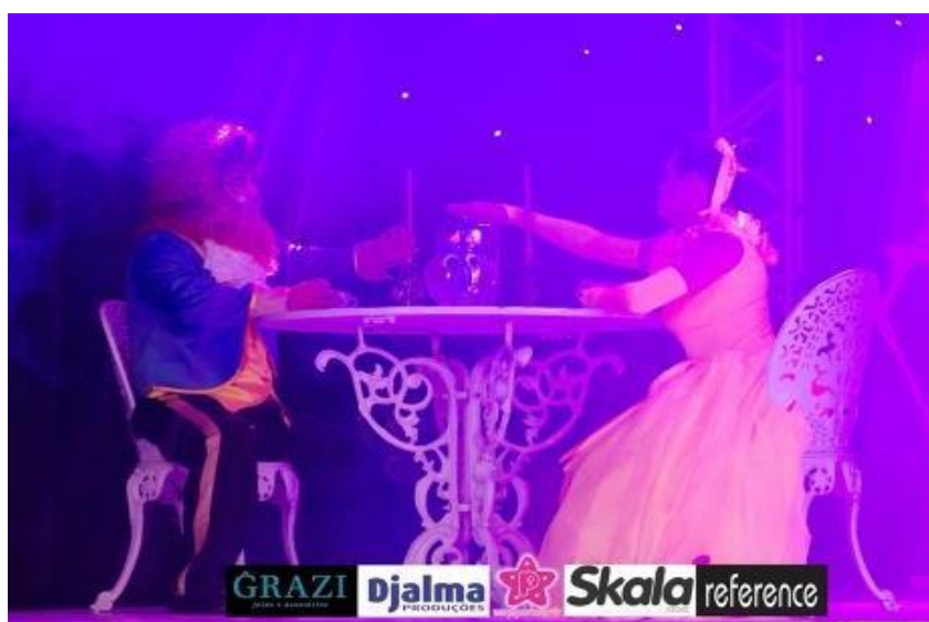
Figuras 6 e 7: Festival Regional- São Ludgero.