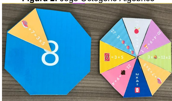
Figura 2: Jogo Octógono Algébrico

O jogo começou com cada participante escolhendo um octógono. Em seguida, os triângulos foram embaralhados, de modo que o jogador inicial ficasse com nove peças e os demais com oito. O primeiro participante verificava se algum de seus triângulos correspondia ao seu octógono e, caso positivo, colocava apenas um sobre ele. Em seguida, virava suas peças para que o próximo jogador retirasse um triângulo sem olhar. Esse procedimento se repetiu a cada rodada. O jogo prosseguiu nessa dinâmica até que, ao final, venceu o participante que conseguiu completar seu octógono com os oito triângulos que apresentavam a correspondência correta, conforme ilustrado na Figura 2.