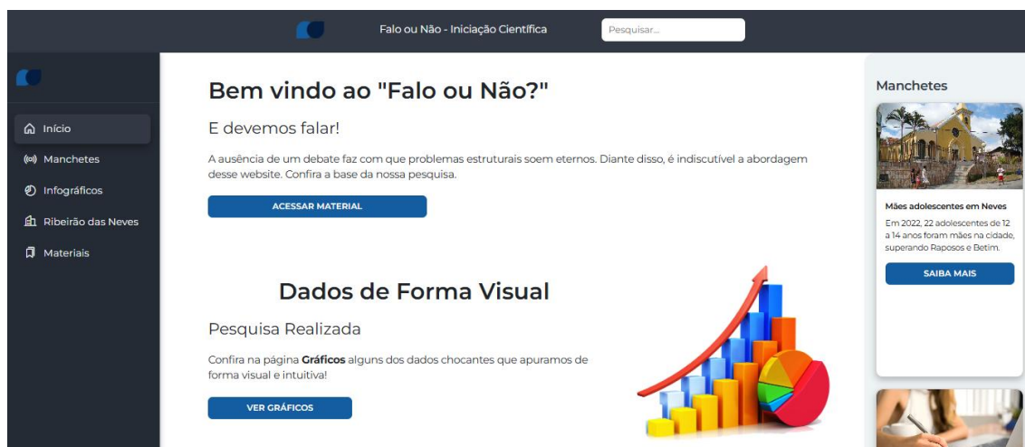
Figura 1. Captura de tela da interface inicial do site.

A Figura 1 ilustra a interface principal do site. A aba "Manchetes" destaca as principais informações apuradas. Já a aba "Gráficos" contém gráficos interativos resumindo dados encontrados. A aba "Ribeirão das Neves" mostra os dados sobre a cidade. Por fim, a aba "Material", contém as referências utilizadas na pesquisa e materiais educativos desenvolvidos para divulgação. Essa estrutura facilita a navegação no site, permitindo a exploração detalhada dos temas abordados de modo atrativo.