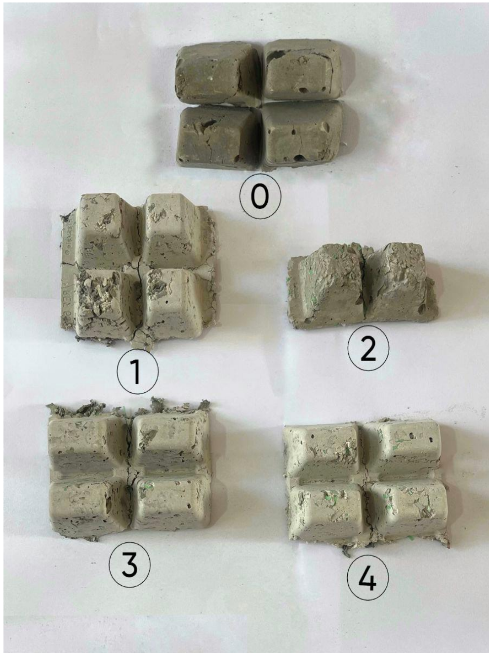
Figura 1. Corpos de prova