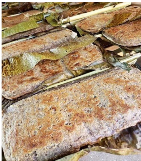
Figura 11: bolo assado na folha da de bananeira.

A figura 11 mostra o bolo assado na folha e a figura 12 apresenta uma fatia do bolo, com pedaços de coco babaçu e cravo aparentes.