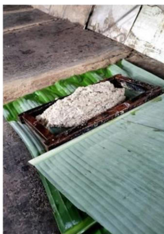
Figura 9: massa do bolo sobre a folha de bananeira e com o molde.