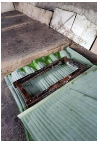
Figura 08: folha da bananeira e molde de madeira sobre o forno.