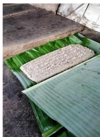
Figura 10: Massa sobre a folha e da bananeira sem o molde.