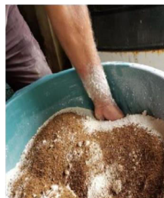
Figura 7: mistura com dos se cos.