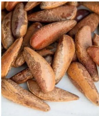
Figura 2: Amêndoa coco babaçu inteira.

Seguindo tem-se os processos de preparação do caldo rapadura (que consiste em desmanchar a rapadura em água quente em um caldeirão transformando em um caldo viscoso) e da extração do leite de babaçu que é produzido pilando a amêndoa no pilão, até que fique em pedaços bem pequenos que depois ele volta para o pilão novamente com água para ser extraído o leite de coco. Nas figuras 2, 3 e 4 podemos observar o coco de babaçu pilado.