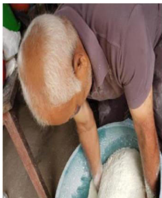
Figura 5: Mistura da massa de puba farinha de mandioca.

doce pilados previamente (figuras 5, 6 e 7). Depois vai adicionando aos poucos o mel da rapadura até que fique bem homogênea. Após todos os ingredientes misturados a massa é posta para descansar enquanto são preparadas as folhas de bananeira que servirão de fôrma para assar o bolo.