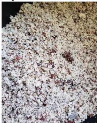
Figura 3: Coco babaçu após pilado.