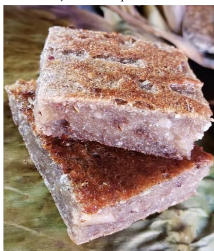
Figura 12: fatia do bolo, com pedaços coco babaçu e cravo aparentes.