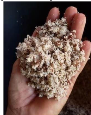
Figura 4: Coco babaçu após pilado detalhe aproximando.