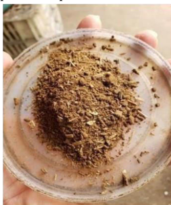
Figura 6: Mix de ervas após serem piladas no pilão.