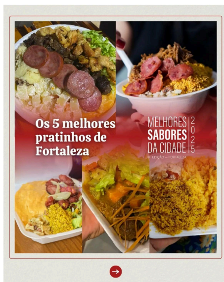
Figura 5 - Chamada para votação dos 5 melhores pratinhos de Fortaleza