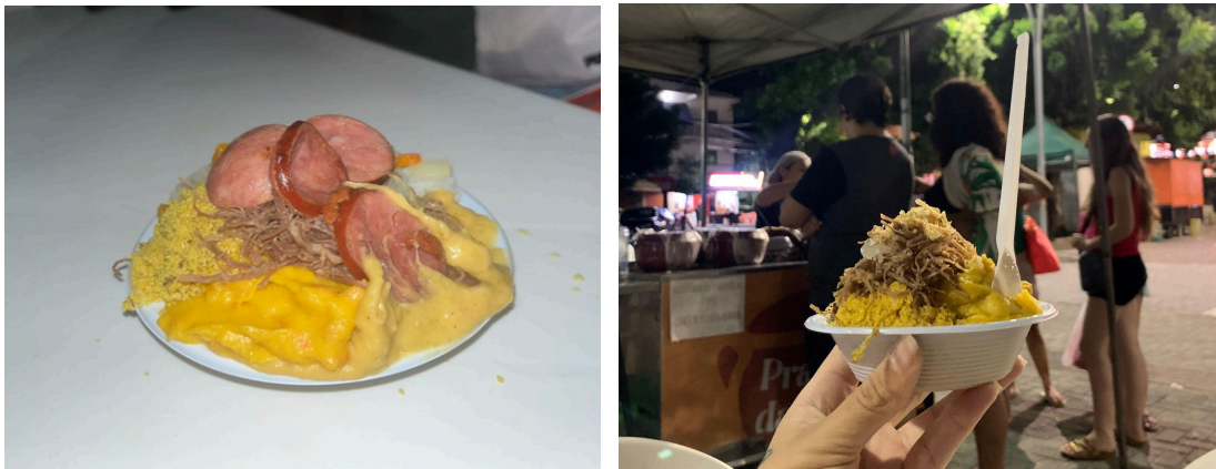
Figuras 1 e 2 - Representação de pratinho cearense

Ribeiro (2024) complementa essa ideia afirmando que o prato está profundamente entranhado na dinâmica urbana de Fortaleza, em uma troca mútua de significados. Ele está presente no cotidiano dos moradores, está nas praças, nas calçadas e também presente em diversas celebrações, como batizados, aniversários, casamentos e na festa junina, como a autora elabora: “Fortaleza, com seu povo acolhedor e seu espírito vibrante, encontra no pratinho um reflexo de sua própria identidade, um prato que fala a língua do povo e conta suas histórias através dos sabores.” (p. 49, 2024).