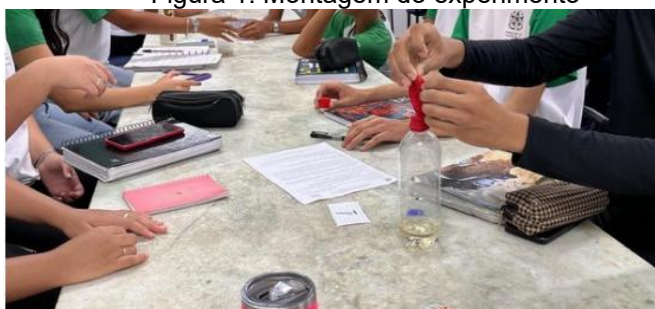
Figura 1: Montagem do experimento

Essa metodologia proporcionou uma vivência prática, investigativa e colaborativa, aproximando a Química da realidade do estudante e reforçando a compreensão de conceitos teóricos de forma concreta e significativa.