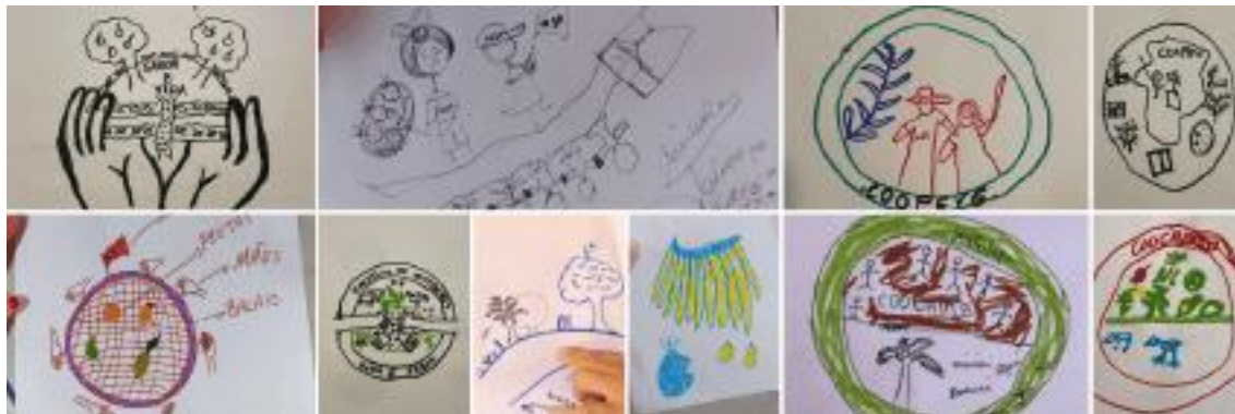
Figura 5 – Desenhos das cooperativas, segunda etapa do processo de cocriação

Retomando Nêgo Bispo (2023), a cosmologia dos seres diversos, aqueles que cultivam um conhecimento orgânico, construído com a terra, e que não possuem um pensamento linear, mas começo-meio-começo, e isso é uma forma de circularidade. Quando pensamos nesta forma de ver o mundo, ela abarca a complexidade da teia da vida, com seus ciclos naturais, de uma forma de sustentabilidade plena e orgânica, que essas pessoas assentadas traduziram, em nosso processo, com seus desenhos.