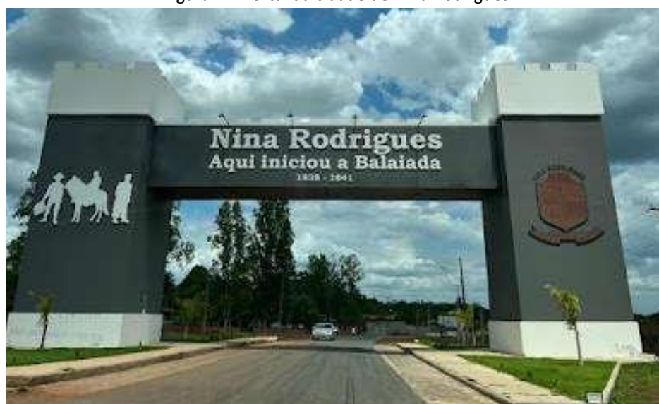
Figura 1 – Portal da cidade de Nina Rodrigues

Na chegada ao município de Nina Rodrigues, localizado a 185 km de São Luís, MA, lugar onde vivem as mulheres do Coletivo de Mulheres Resistir e Produzir, há um portal construído pela prefeitura com a frase “Aqui iniciou a Balaiada” referindo-se a revolta maranhense que ocorreu no período regencial (1838 – 1841) contra os abusos sofridos por governantes e latifundiários. Ainda que este momento da história esteja há dois séculos de distância do período atual, as terras de Nina Rodrigues ainda carregam este passado sombrio, marcado por sistemas exploratórios que ainda assombram os produtores locais.