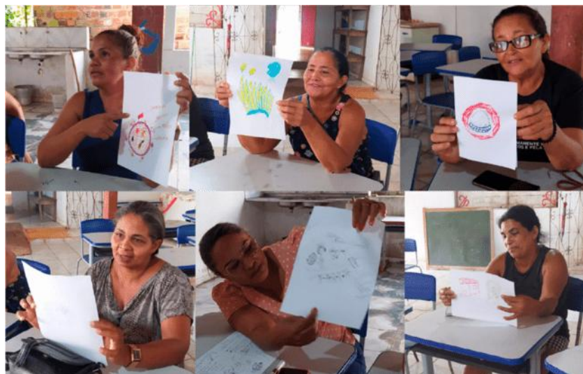
Figura 6 – Agricultoras mostrando os desenhos de frutas e balaios