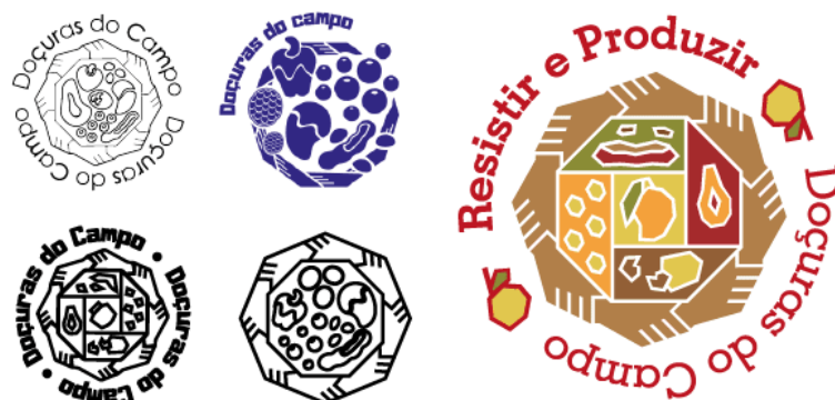
Figura 7 – Etapa de criação da marca (à esquerda) e marca finalizada (à direita)