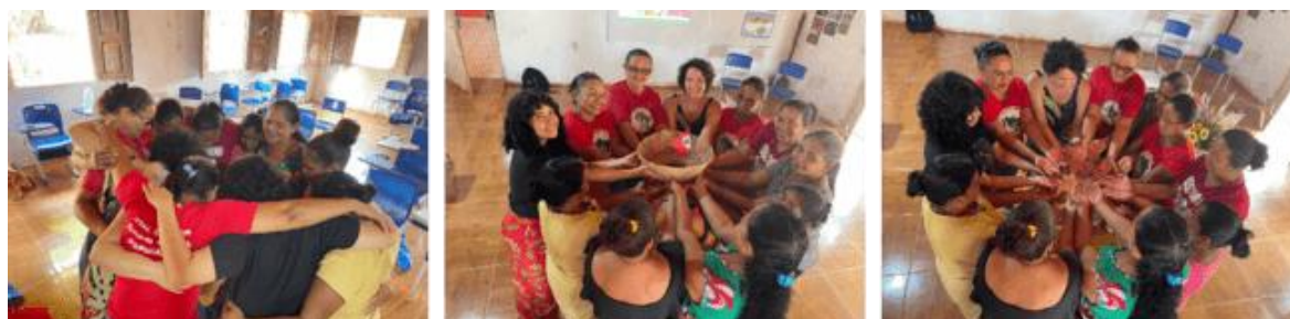
Figura 8 – Registro após o momento da cantiga

Na apresentação do projeto da marca, o coletivo, após deliberar e refletir sobre a marca apresentada, nos presenteou com uma mística (Figura 8), que envolveu cânticos, rodas e abraços, e isso muito nos ensinou sobre envolvimento, relacionalidade e cuidado. Escobar, Sharma e Osterweil (2024) explicam que para fazer design a partir da relacionalidade é preciso estar ciente de que nossas relações com outros e com o mundo, em geral, são como grandes emaranhados de fios que não podem ser desamarrados, podendo ser estes fios corpos, mentes, corações, comunidades e saberes. Completam, ao falar que para encontrarmos um futuro de amor, é preciso viver este amor no presente, nos permitindo sermos apoiadas, inspiradas e interconectadas. Isso também é o que nos permite encarar as tragédias do passado e poder imaginar novos horizontes para o futuro.