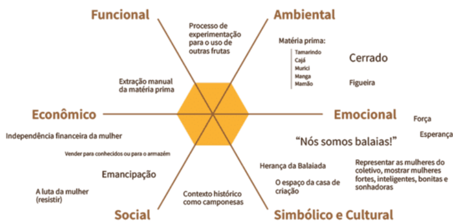
Figura 4 – Esquema estrela de valores do coletivo Resistir e Produzir

Dentro da análise, identificamos alguns fatores em comum entre as cooperativas, como nas esferas de valor ambiental e social. Na estrela de valores do coletivo Resistir e Produzir destacaram-se os valores sociais e simbólico-culturais, estando ligados a luta feminista dentro do contexto camponês.