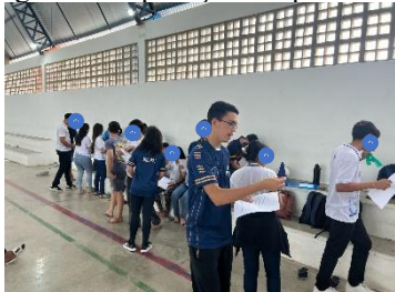
Figura 3 – Aplicação do questionário.