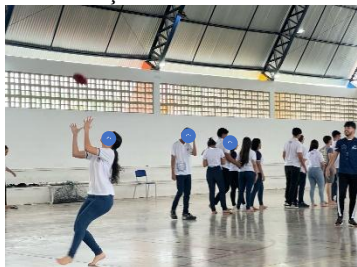
Figura 1 – Introdução aos fundamentos do frisbee.

Por fim, com relação ao ODS 16 (Paz, Justiça e Instituições Eficazes), 52,4% relataram que há resolução pacífica e cooperativa de conflitos durante as partidas entre os participantes, e 47,6% disseram que a resolução dos conflitos pacífica e cooperativa ocorre às vezes. Com isso, os resultados mostram que o Ultimate Frisbee contribui para a promoção de valores essenciais à convivência escolar e à formação cidadã dos alunos. Sua prática reforça o respeito mútuo, a autonomia dos participantes e o trabalho em equipe, aspectos que dialogam diretamente com os princípios da Educação Física escolar.