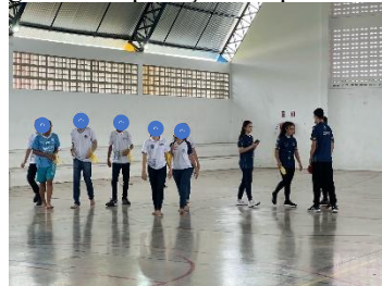
Figura 4 – Aplicação do questionário.