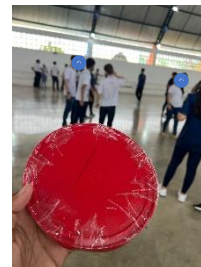
Figura 2 – Disco do frisbee reciclável.