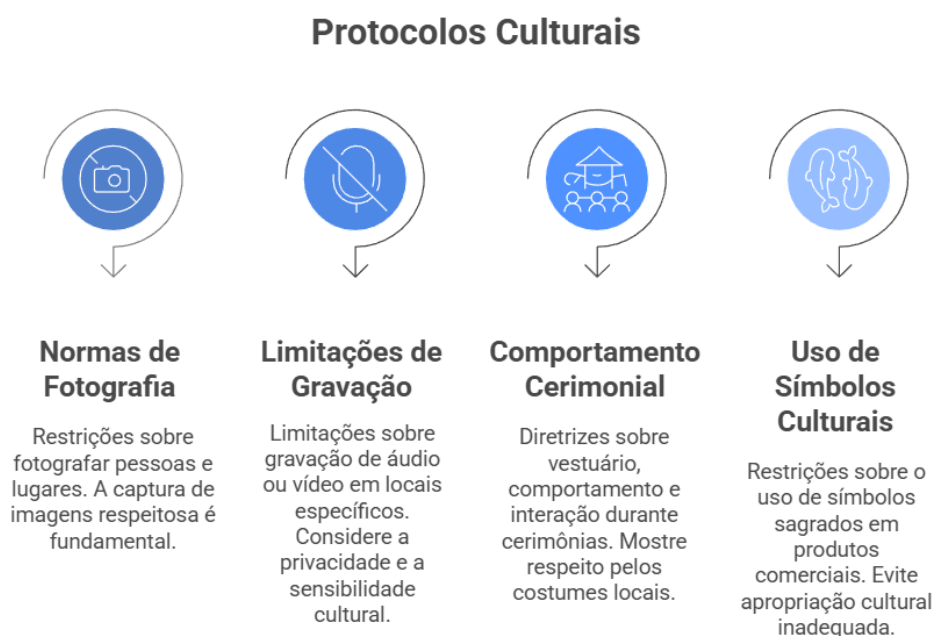
Figura 4 – Proposta de Protocolos Culturais

Entendemos os Protocolos Culturais como o conjunto de diretrizes flexíveis que regulam as interações entre visitantes, comunidades e intermediários turísticos. Diferenciam-se de meros códigos de conduta por seu caráter participativo, contextual e processual, detalhados visualmente na Figura 4.