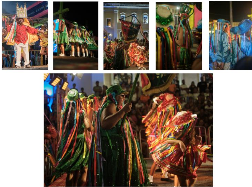
Figura 2 - Festival Arthur Bispo do Rosário. Japaratuba/SE