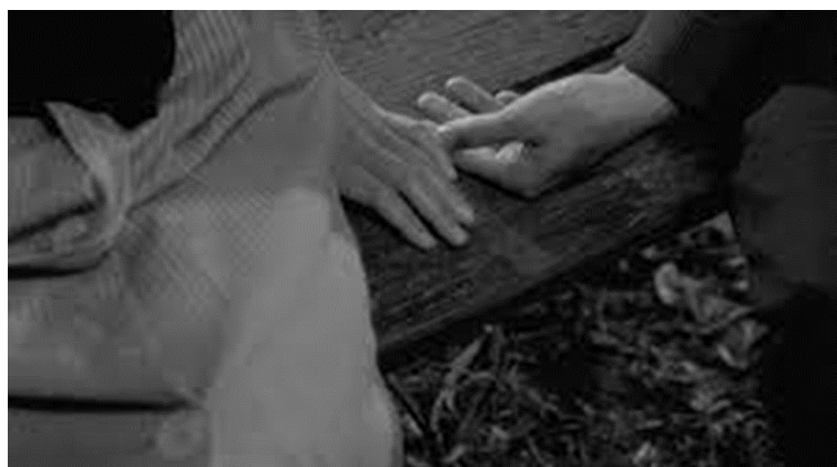
Imagem 5. [Hands of Bresson, 2014].

Ao rever o curta de 2014, “Hands of Bresson” 3 , em homenagem ao cineasta minimalista francês (que começou querendo ser pintor), as mãos ditam os ritmos das ações das personagens em diversos filmes. Mãos que se tocam, se afastam, fazem carinho em animais, roubam carteiras, ligam e dirigem carros. Adoçam um chá, ou derrubam uma xícara de café. Assim como numa aula, as mãos ditam entonações, chamadas de atenção, registros nos quadros e nos cadernos. As mãos de uma professora que compõe um fazer com os bordados. As mãos, as linhas, a invenção de uma outra ciência frente as imobilidades das “ciências rápidas”(Stengers, 2023) as feitura de palavras com linhas sobre o caderno de anotações, as palavras bordadas frente ao texto acadêmico. Gestos de interrupção a tempos que teimam em acelerar a vida (e as ciências).