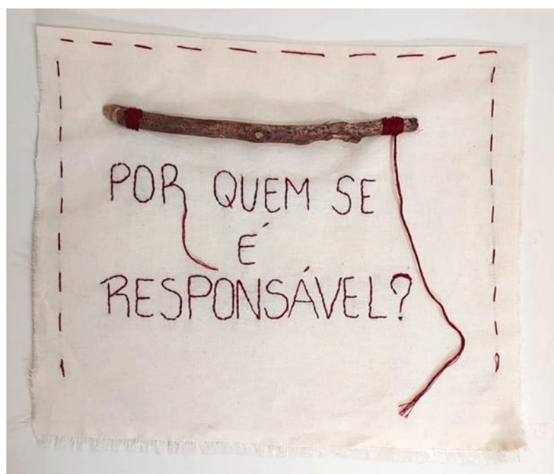
Imagem 2. [Responsabilidades, Dal Pont, 2025]

adicionamos faz diferença no mundo; e tornando-se capaz de responder pela especificidade dessa diferença” (Stengers, 2023, p.174).