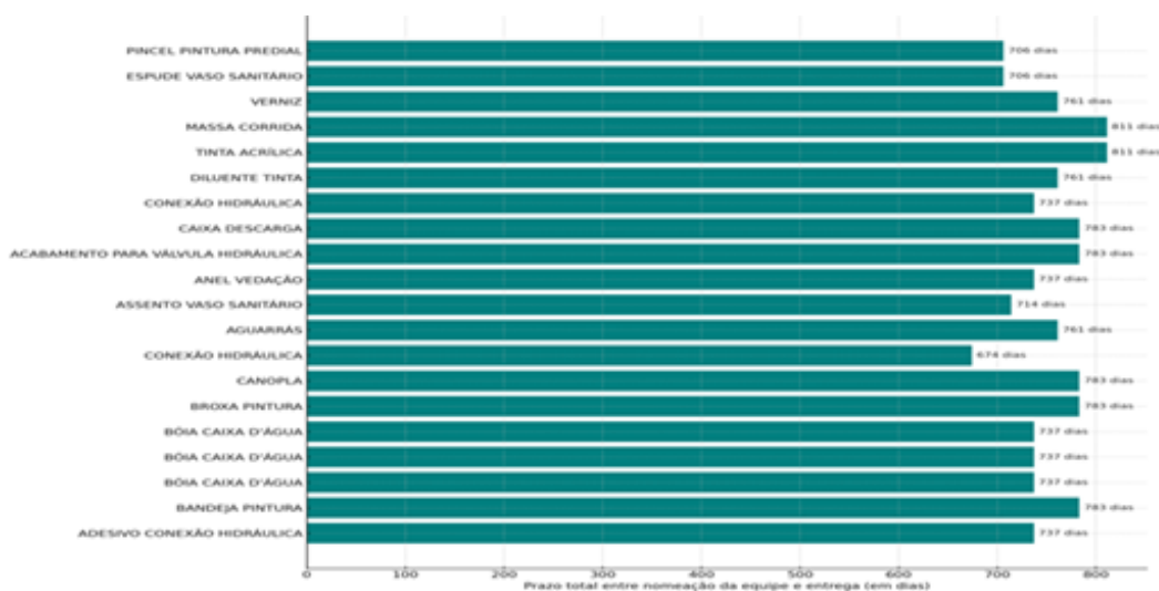
Gráfico 1 – Extensão de tempo entre nomeação da equipe e entrega dos itens

O gráfico 1 a seguir, evidencia os prazos desde a nomeação da equipe de planejamento até a entrega efetiva realizada pela empresa fornecedora no Campus Porto Velho.