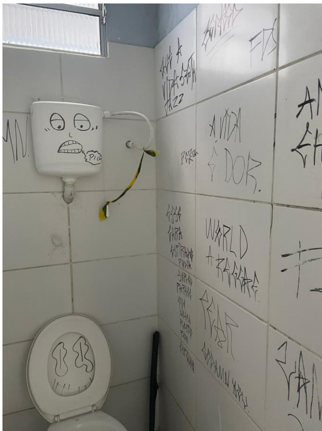
Figura 1: Banheiro masculino, 2025.