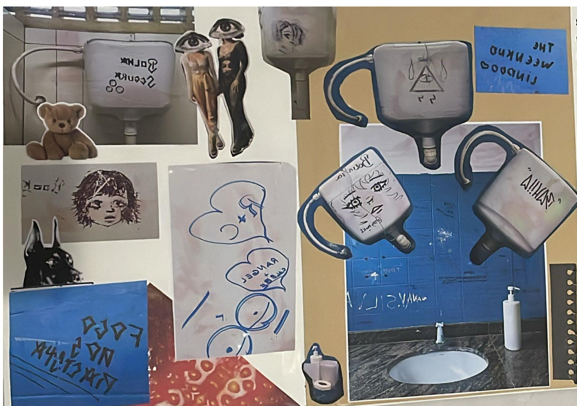
Figura 4: Shetchbook recortes dos banheiros visitados, 2025

O sketchbook foi sendo construído paralelamente às visitas às escolas, assumindo-se como espaço de atravessamentos, em que observações, afetos e experiências se inscrevem de forma plástica e sensível. Mais do que um simples registro, ele configura um território de escuta e criação, no qual a me posiciono ora como observadora, ora como interlocutora silenciosa, dos (as) sujeitos(as) que habitam e produzem os espaços escolares.