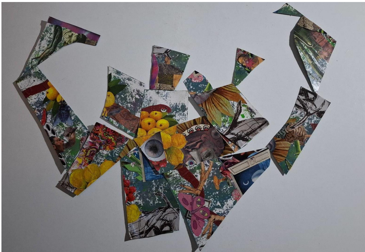
Figura 5: Frame da animação em Stop-Motion utilizada no audiovisual corpo-trilha.