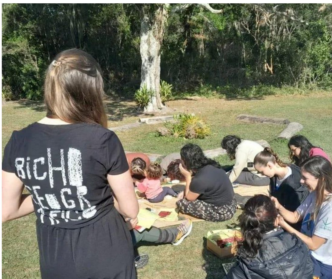
Figura 1: Imagem autoral tirada em um encontro de formação no PAEST.

O PAEST foi nossa casa, lá encontramos com uma educação ambiental em movimento, um lugar privilegiado no sentido de abertura para conexões-ativas. Para além de um parque de preservação é meio de ligação entre universidades, escolas, órgãos ambientais, comunidades tradicionais, comunidades de bairro, além dos visitantes de diferentes segmentos de interesse. Onde há saberes em circulação, encontros, experimentações, formações, residências, onde o comum pode manter-se emerso por meio da aliança.