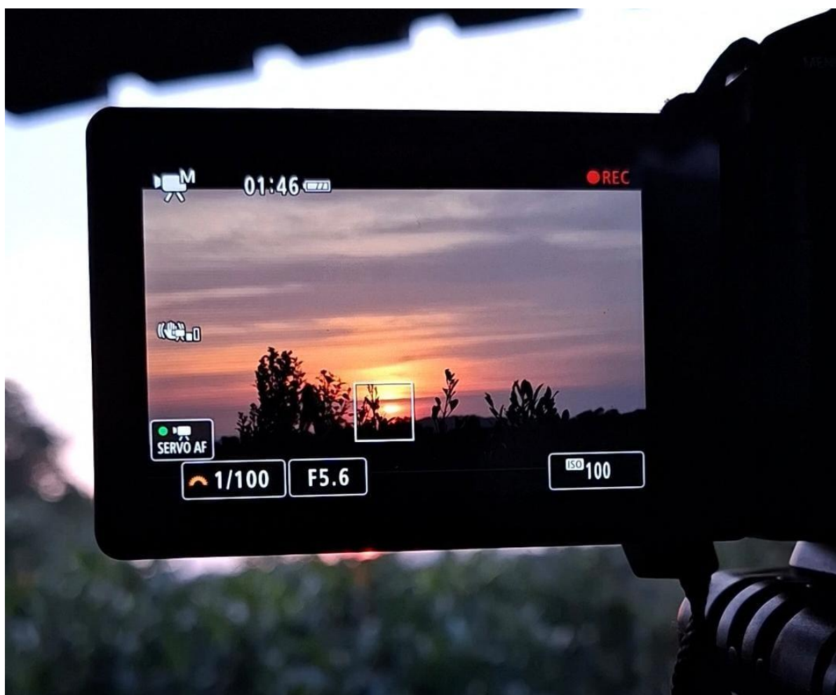
Figura 2: Imagem autoral tirada nas gravações diurnas no PAEST.

Lá entramos em contato direto com a ideia de desaceleração, cada trilha, formação e momento que percorríamos era espaço para deixar de lado a rotina da velocidade urbana e a tentativa de prolongar essa desaceleração. Através da criação deste audiovisual buscamos imagens que se detivessem nos detalhes das trilhas do PAEST. Pequenos pedaços que, por si só, nos convidasse a parar por alguns instantes e ouvir o que a terra tem a dizer. Os detalhes importam, pois, como lembra Haraway (2023), são eles que nos vinculam às responsabilidades reais. Por isso, nossa câmera era sempre apontada para um fragmento: uma folha, uma aranha, uma formiga, um galho, uma flor, um musgo, um caule. Gravávamos trinta segundos de cada detalhe, acreditando que cada abertura poderia se desdobrar em outras conexões. Até mesmo nas filmagens noturnas a busca era pelos detalhes, mesmo que estes estivessem (in)visíveis.