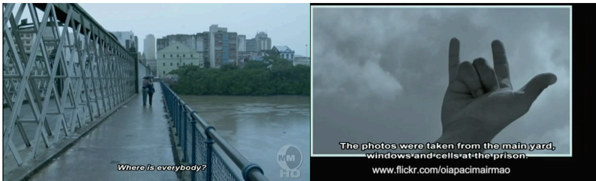
Imagem 3 :Capturas de telas em Recife Frio (2009)

As imagens e seus aparatos ópticos não apenas registram, mas produzem corpos e sentidos para essa nova configuração de cidade e de seus habitantes. São modos de verem e serem vistos que se tornam materialidades incorporadas. Como nos lembra Donna Haraway (1995), a visão é sempre um ato situado e corporificado, e aqui testemunhamos corpos que outrora experimentavam a liberdade dos espaços abertos, agora sendo reconfigurados pelo agenciamento climático. Portanto, mesmo que haja o agenciamento “Os atores existem em muitas e maravilhosas formas. Explicações de um mundo ‘real’, assim, não dependem da lógica da ‘descoberta’, mas de uma relação social de ‘conversa’ carregada de poder” HARAWAY (1995, p. 37).