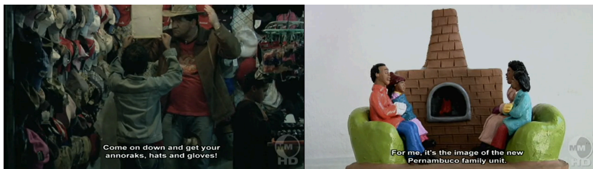
Imagem 2: Capturas de telas em Recife Frio (2009)

As representações artesanais locais também são elementos imagéticos marcantes para demarcar esse agenciamento climático, as esculturas com vestimentas invernais e lareiras retratam comportamentos da nova configuração da família pernambucana.