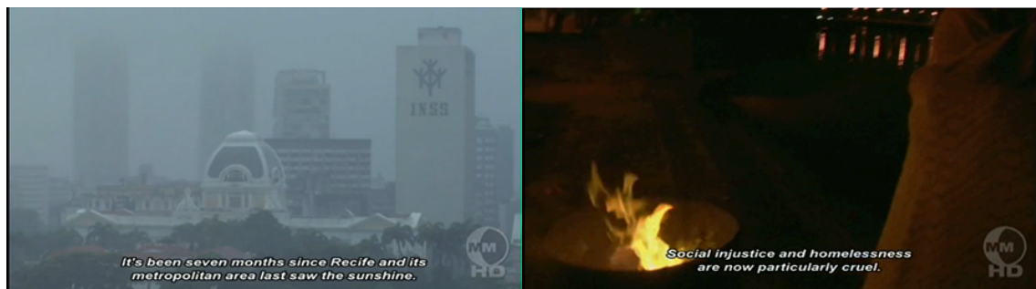
Imagem 1: Capturas de telas em Recife Frio (2009)

Desta forma, no agenciamento climático, se entrelaça em linhas imagéticas com histórias que percorrem toda a narrativa, afetando repentinamente as paisagens naturais, as identidades, elementos da cultura popular, nostalgias e sentimentos. A dinâmica do espaço urbano, onde questões socioespaciais como a especulação imobiliária e o abandono da população sem casa se intensificam e ganham novos aspectos. Quando a onda de frio se alastra pela cidade outros arranjos de figuras de barbante vão se formando, como pensou Haraway (2016, p. 1) “arranjos de espécies orgânicas e de atores abióticos fazem história, tanto evolucionária como de outros tipos também.”