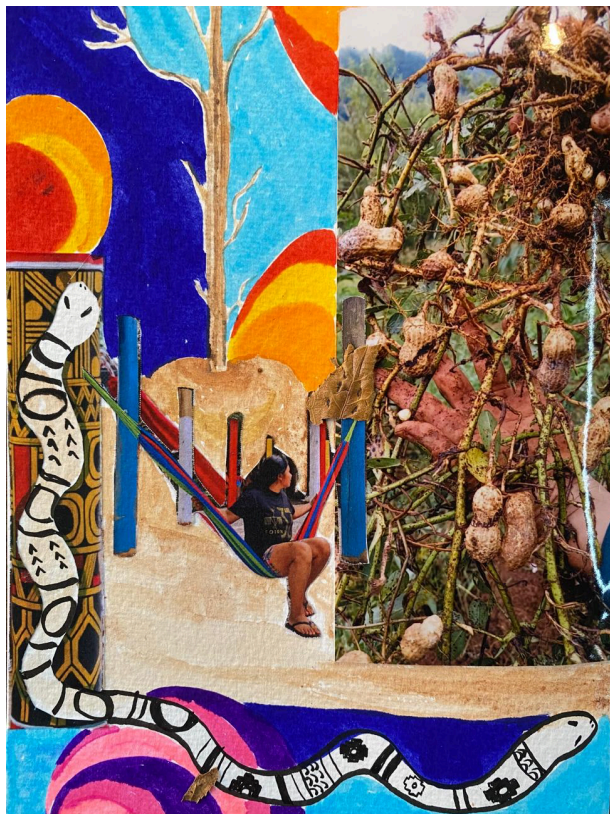
Imagem 3: Colagem realizada durante oficina de criação coletiva a partir de imagens do Jardim

Troncos foram erguidos sobre a terra repleta de raízes e sob as copas do mundo vegetal que lá habitava. Pedras brancas, esculpidas por rios e formadas por atividades vulcânicas tão antigas quanto as narrativas que ali se instauraram, e pedras de argila, composta por minerais de rochas sedimentares, cobriram o solo e abraçaram cepos de diferentes comprimentos. Cada tronco foi disposto de maneira que uma teia de redes os conecta, indicando potências e afetos do encontro com a diferença.