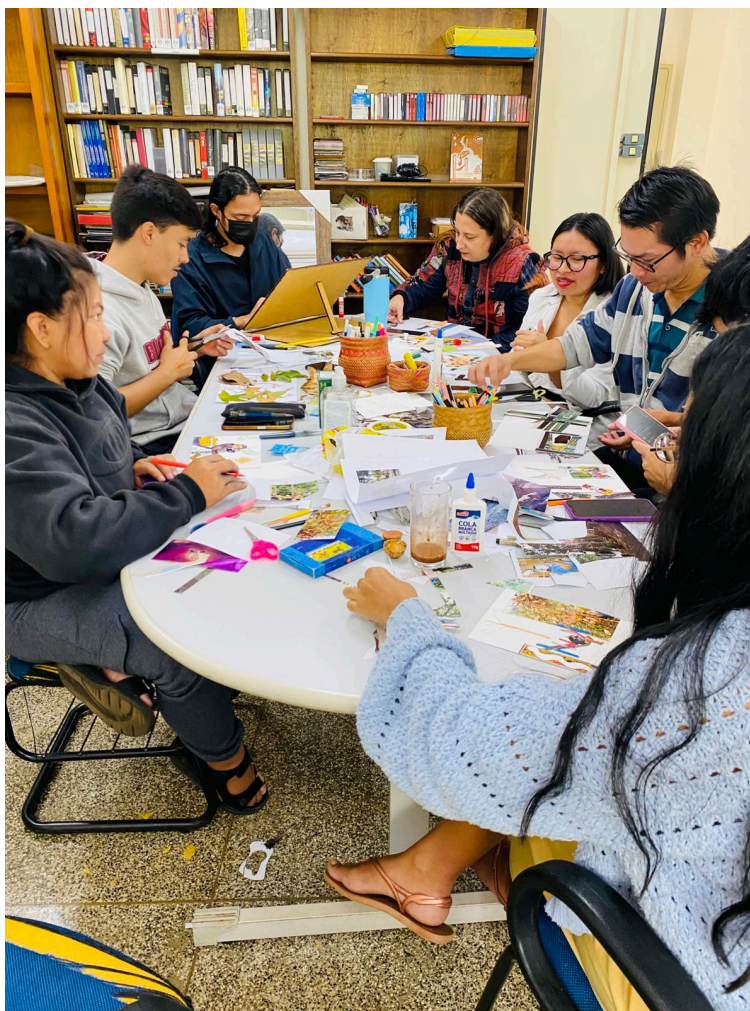
Imagem 4: Oficina de criação coletiva com fotografias e desenhos com integrantes do projeto

PENSAR COM AS IMAGENS - MODOS OUTROS DE CRIAR E HABITAR MUNDOS