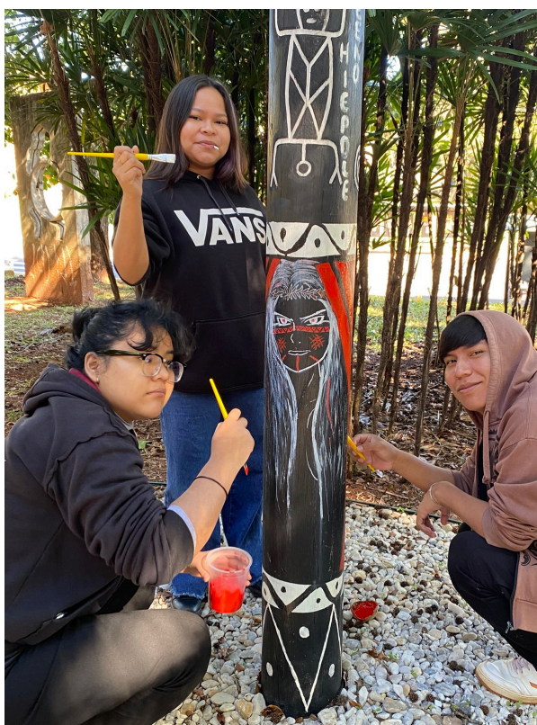
Imagem 1: Pintura do tronco Baniwa/Baré, realizada por integrantes do projeto

Em formato circular, a obra “Jardim dos Saberes Ancestrais” (2024) é formada por doze troncos e trinta bancos de madeira, pintados com desenhos e grafismos de povos indígenas e de comunidades afro-diaspóricas, entre outras ancestralidades. Entre os troncos, estendem-se redes coloridas, embaixo de frondosas árvores, sobre um chão de pedras claras. O espaço foi criado para acolher encontros, aulas, momentos de descanso e de atividades artístico-culturais.