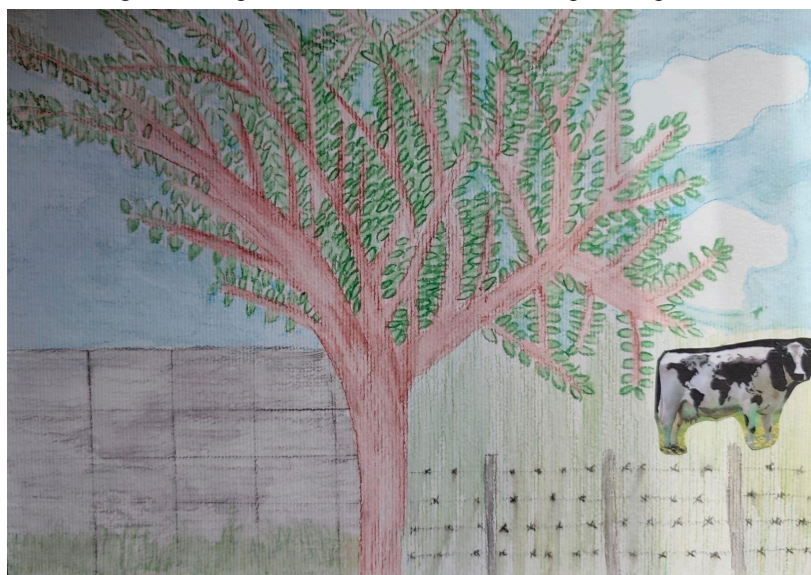
Figura 1: Dispositivo - Desenho baseado na palavra pureza

seria o desenho com base na palavra pureza e depois o vídeo, sobre o desenho, teria duração de um minuto. Com esse protocolo algo começou a se mover aqui. Diante disso, pensar o ato de desenhar, a busca pela criação de uma imagem nos fez olhar para o processo de produção dos desenhos realizados pelas crianças. Comecei a me ocupar pelas imagens com recordações da minha infância que foram chegando devagar. Esta conexão trouxe, no primeiro momento, a relação com a natureza. Na figura 1 mostro a lembrança do pé de goiaba cujos galhos me acolhiam ao saborear suas goiabas, serviam para subir no muro onde caminhava me equilibrando; depois a cerca de arame farpado, que eu pulava para correr do outro lado, interagia com animais.