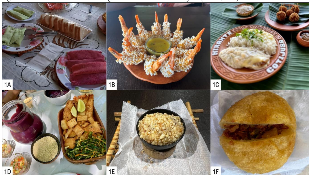
Figura 1 – Potencialidades do turismo-gastronômico da Ilha de Cotijuba (Belém, Pará)

Legenda: 1A – Tapiocas coloridas; 1B – Camarões empanados com farinha de tapioca e redução de tucupi; 1C – Filhote ao Molho da Castanha do Pará; 1D – Peixe à dorê; 1E – Brigadeiro de pripioca; 1F – Coxinha de massa