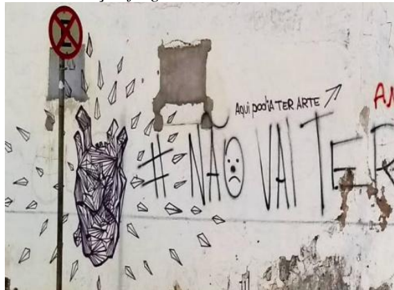
Imagem 1: Primeiro coração fragmentado de Rieux em São João Del Rei, MG.

marcador de passos, sinal que (res)(des)organiza memórias espalhadas pela cidade (Nogueira, 2023).