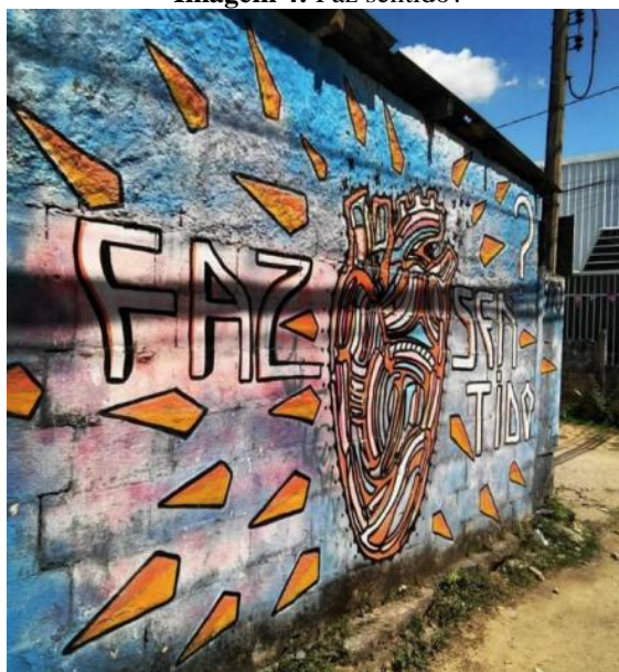
Imagem 4: Faz sentido?

Durante a construção de outro coração fragmentado (Imagem 4), podemos perceber ainda como a imagem pulsa entre o artista e aqueles que presenciam seus gestos, entre memórias e experiências, transformando a cidade em um espaço de sentidos ocultos. Rieux compartilhou, em nossas conversas na varanda de sua casa, o episódio de uma senhora que permaneceu longos minutos diante da pintura, durante a sua construção, absorvendo cada fragmento. Essa atenção e pausa da transeunte fez o artista se questionar sobre o sentido de seu trabalho, refletindo se suas intervenções eram capazes de provocar experiências e afetos significativos.