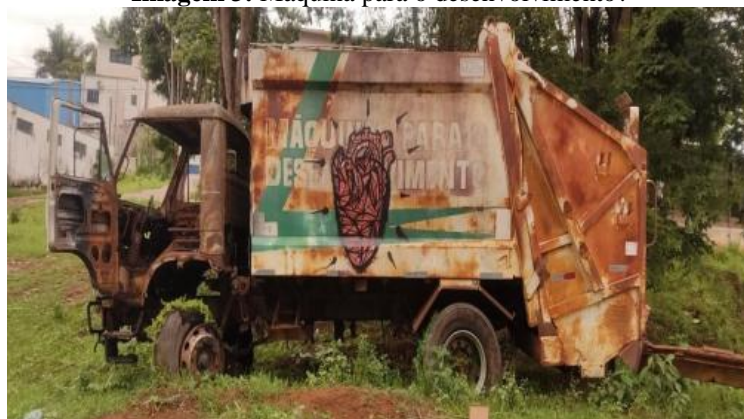
Imagem 3: Máquina para o desenvolvimento?

Nesse movimento, o coração fragmentado de Rieux atua como imagem-dispositivo, pulsando e atravessando corpos, educando olhares e sentidos, e convidando aqueles que o encontram a perceber que os espaços cotidianos da cidade podem ser renovados. Um signo que alerta para a possibilidade de criação de novos mundos, inscrevendo no cotidiano a potência de sentir, imaginar e reinventar o espaço urbano. Ao mesmo tempo, em sua força visual, o coração se apresenta como gesto de crítica, como em outra intervenção onde Rieux o pintou sobre a carcaça enferrujada de um caminhão de lixo abandonado (Imagem 3). Ali, com traços pretos, preenchido com a cor vermelha, seu coração articula simultaneamente crítica e convite à reflexão, abrindo fendas para mais uma vez percebermos, habitarmos e interagirmos com o urbano.