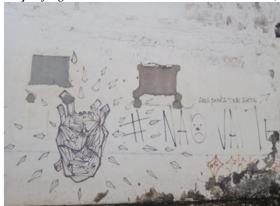
Imagem 2: Primeiro coração fragmentado de Rieux em São João Del Rei, MG, sete anos depois...