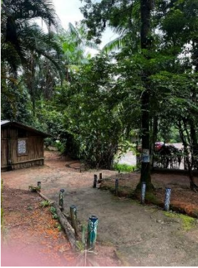
Figura 01: Imagens da entrada da Aldeia Guarani.

de março de 2024 no Centro Universitário SENAI-SP, campus Barra Funda. Em 10 de março, as alunas realizaram uma visita à Aldeia Guarani, na Praia da Boraceia, para entrega das doações e realização de uma oficina com a comunidade (Figura 1).