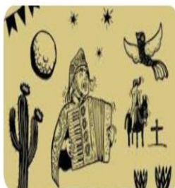
Nordeste Imagens - Procure 17,198 foto...