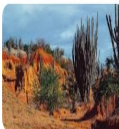
Fotos de Nordeste - Baixe fotos grátis d...