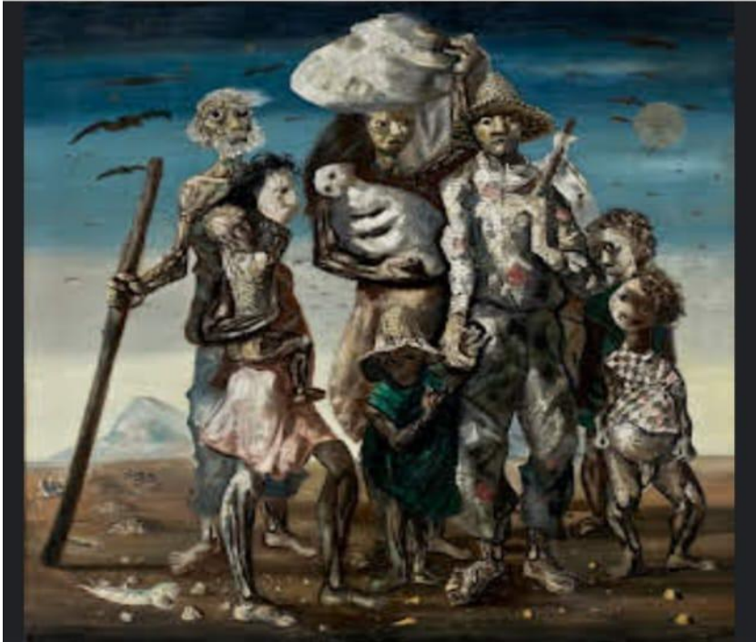
Figura 2- Os retirantes, Cândido Portinari, 1944