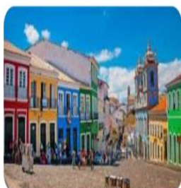
Cidades históricas do Nordeste: explore...