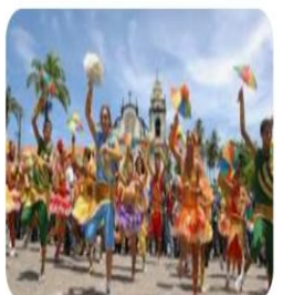
3 Grandes destinos culturais do norde...