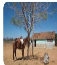
Região Nordeste: estados, capitais, ...