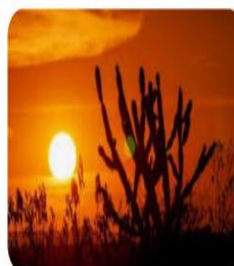
Cacto em silhueta ao pôr do sol. Cen...