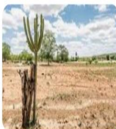
Região Nordeste: estados, capitais, da...