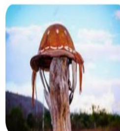
62.600+ Nordeste fotos de stock, ima...