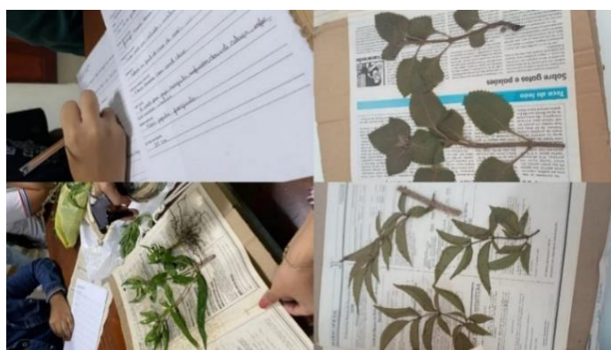
Figura 1 - Realização das exsicatas

Os estudantes, organizados em grupos, realizaram a coleta e confecção das exsicatas, processo que envolveu a prensagem e desidratação das espécies. Neste procedimento as plantas foram borrifadas com álcool 70% e dispostas sobre papelão envolto em jornal. Cada exsicata recebeu identificação contendo o nome da planta, data, responsável pela coleta, nome científico e uso tradicional, objetivando promover uma atividade diferenciada e contextualizada, conforme ilustrado na Figura 1 .