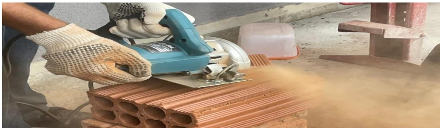
Figura 1- Serrando os blocos

Em seguida, foram executados cortes verticais centralizados nos blocos, simulando rasgos para instalações. Utilizou-se serra mármore com disco diamantado, seguindo medidas padronizadas: 3 cm de largura, 2 cm de profundidade e altura total do vão útil.