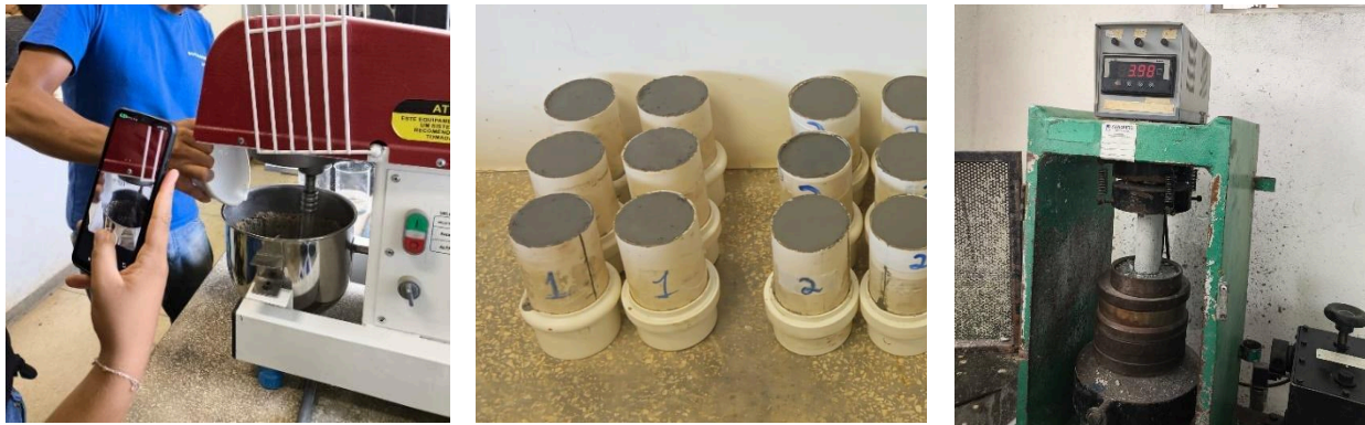
Figura 2 - Argamassas: (a) Preparo das misturas, (b) Moldagem dos corpos de prova, (c) Ensaio de compressão.