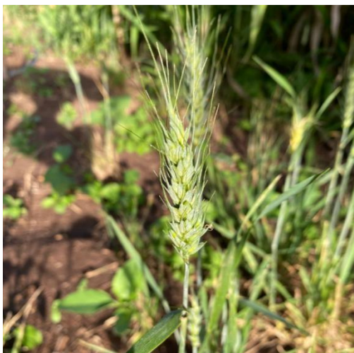
Figura 5 – Espigas sem enchimento de grãos em todas as parcelas que floresceram.