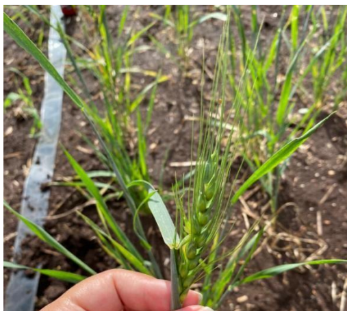
Figura 4 - Detalhe da espiga do tratamento 7, bloco 2, onde foi registrada a primeira emissão floral.