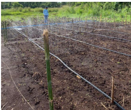
Figura 3 - Sistema de irrigação instalado e em funcionamento para suprimento hídrico das parcelas.