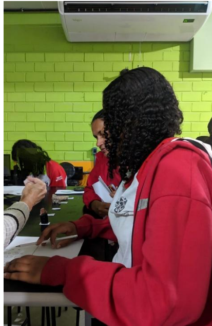
Figura 1 – Minerais dispostos sobre a mesa