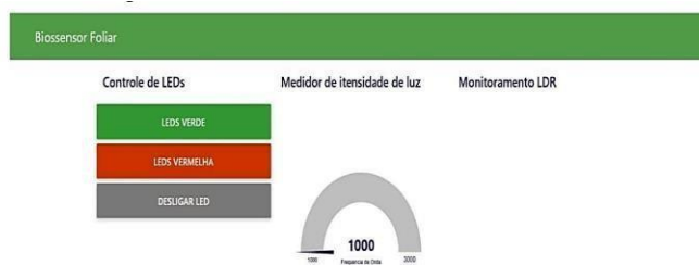
Figura 2- Dashboard desenvolvido no Node-RED