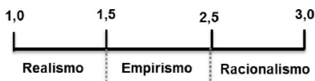
Figura 1 – Faixa de Scores.

Etapa II: Calculou-se a média dos scores de cada estudante por fase, definindo faixas para cada zona filosófica e identificando a origem predominante do conhecimento, conforme a Figura 1 . Esse procedimento considera a pluralidade de pensamento, já que um mesmo conceito pode gerar respostas em diferentes zonas, e foi aplicado a todos os participantes em todas as fases.