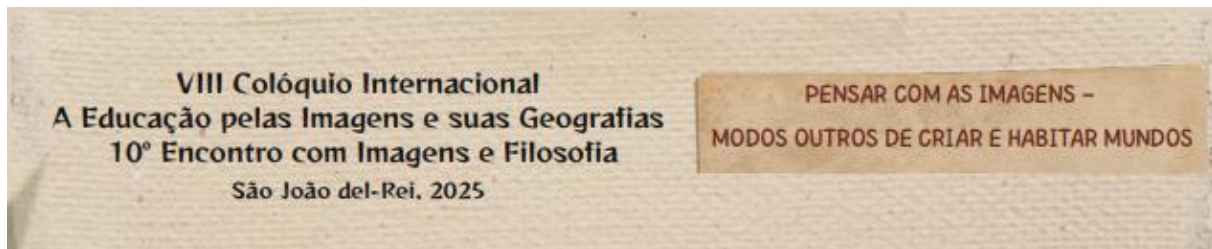
Figuras 3 e 4