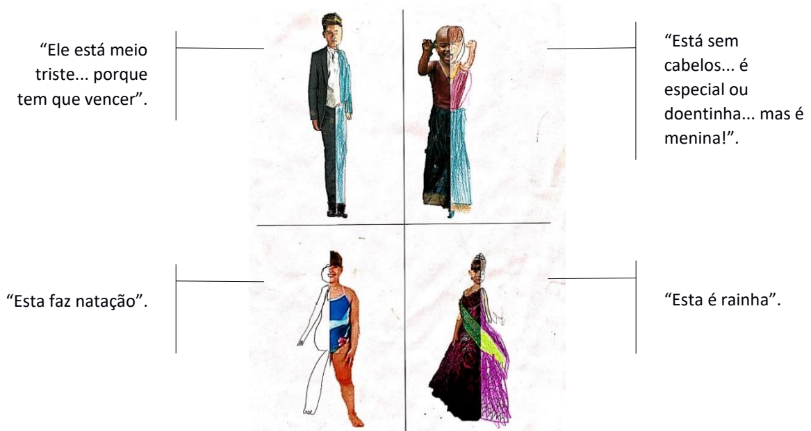
Figura 03 – Espelhamento de Helena