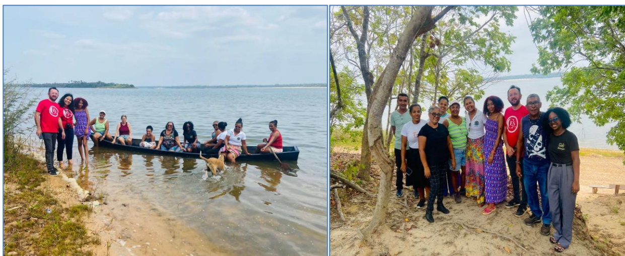
Figura 2- Visita à Comunidade Ciriaco

A figura 2 que segue demonstra momento de interação do grupo de pesquisa com a referida comunidade do Ciriaco: