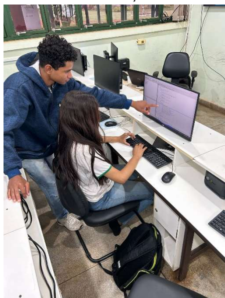
Figuras 1 e 2 – Estudante bolsista do curso médio integrado de informática e a estudante colaboradora do curso de bacharelado de sistemas de informação realizando atendimento de monitoria de programação

As figuras 1 e 2 respectivamente apresentam os monitores realizando atendimentos sanando dúvidas de outros estudantes em laboratórios de informática do IFTO campus Porto Nacional.