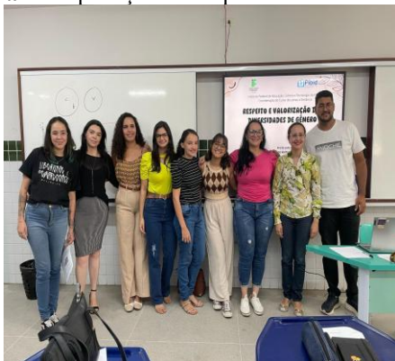
Figura 1 – Aplicação da Sequência Didática em sala.