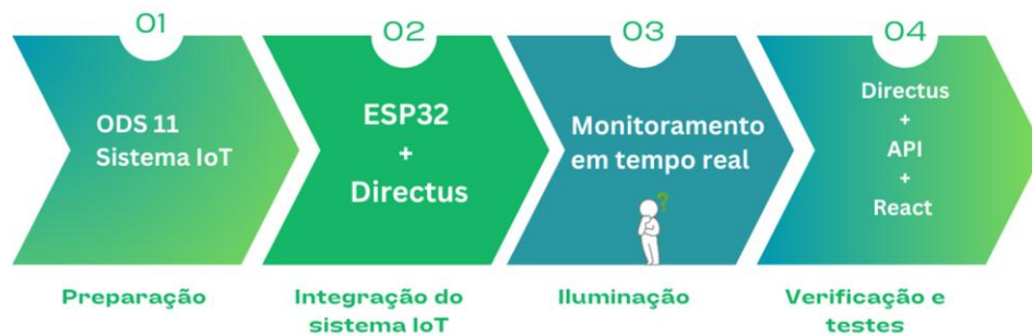
Figura 2 – Metodologia das etapas do Desenvolvimento da Plataforma EcoAdapt

possibilita a criação de dashboards personalizados, o que facilita a interpretação dos resultados por diferentes perfis de usuários. Essa flexibilidade amplia as possibilidades de uso do EcoAdapt em contextos variados, como ambientes escolares, pesquisas acadêmicas e até aplicações industriais. O sistema também se mostra escalável, podendo ser adaptado para incluir novos sensores e protocolos de comunicação, caso haja necessidade futura de expansão. Em resumo, o projeto não apenas cumpre o objetivo inicial de monitoramento da qualidade do ar, como também abre portas para aplicações mais complexas no campo da Internet das Coisas.