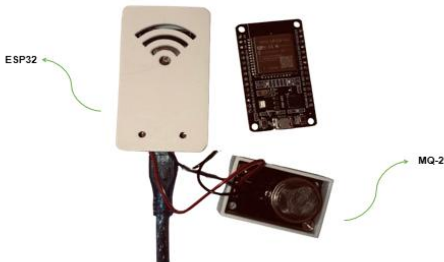
Figura 1 - Protótipo Físico

empregada para o gerenciamento e armazenamento dos dados, permitindo a acessibilidade em tempo real e facilitando análises detalhadas. A integração de tecnologias acessíveis e eficientes no EcoAdapt demonstra a viabilidade de soluções tecnológicas de baixo custo em projetos que visam não apenas o monitoramento ambiental, mas também a conscientização pública e o apoio a políticas de sustentabilidade (Oliveira, 2020).