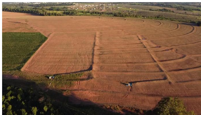
Figura 1 : Localização do experimento no Município de Cianorte/PR

A área do experimento é dividida em 2 megaparcelas de 2,0 ha cada (Figura 1), sendo que na primeira megaparcela não há prática mecânica de controle de escoamento (sem terraços). Na segunda, megaparcela o manejo do solo no cultivo convencional está associado a prática mecânica de controle do escoamento (presença de terraços agrícolas).