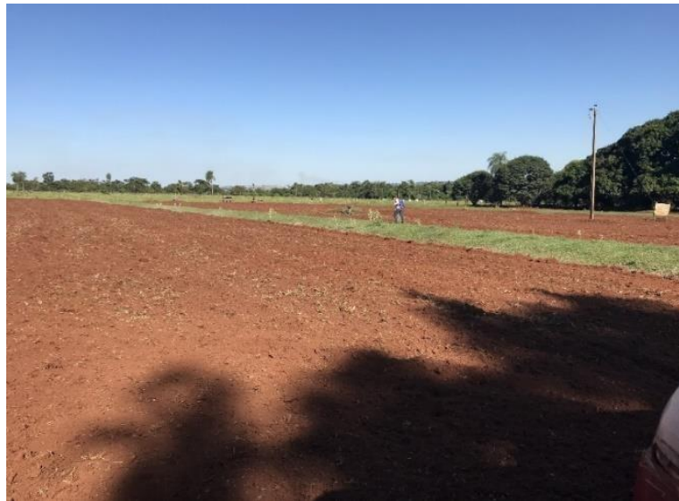
Figura 2 – Solo com gradagem

Em 21 de fevereiro de 2021 a área foi separada em 10 blocos (Quadro 1), sendo que cada bloco com os 4 (quatro) tratamentos. Cada parcela correspondia a uma área de 36 m 2 e entre elas 2 (dois) metros de separação para não ter interferência entre tratamentos. A adubação foi realizada no mesmo dia a lanço manualmente.