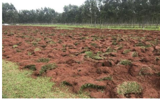
Figura 1 – Preparo do solo