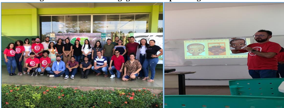
Figura 1 – Jornada Pedagógica no Campus Araguatins do IFTO

O universo de execução do Projeto Afro Music foi constituído de múltiplos espaços dentro e fora da cidade de Araguatins-TO, tendo sua natureza experimental, com ações concretas para a mudança de perspectivas para problemáticas que envolvem esses indivíduos, quanto ao preconceito racial. Este trabalho esmiuçará as metodologias participativas de projeto, à luz de Flick (2009), e por isso, apresenta-se com base na sua consecução as seguintes atividades: