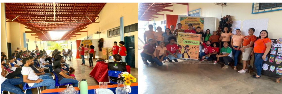
Figura 5 – Ação na Escola Estadual Santa Gertrudes

A figura 4 apresenta dois momentos distintos: a) visita à Comunidade Quilombola Ciriaco (Esperantina)-TO, em 22/10/2024; e b) visita à Comunidade Cacheado (Carrasco Bonito-TO), em 28/10/2024. A primeira comunidade possui remanescentes de quilombos e com eles podemos analisar a musicalidade que possuem. A segunda comunidade é formada por quebradeiras de coco, uma atividade que perpassa pela musicalidade de cantigas populares feitas em coletividade. As visitas trouxeram a compreensão de manifestações culturais que transmitem histórias, tradições e valores de geração em geração, enriquecendo a identidade cultural e promovendo a diversidade (Gomes, 2023).