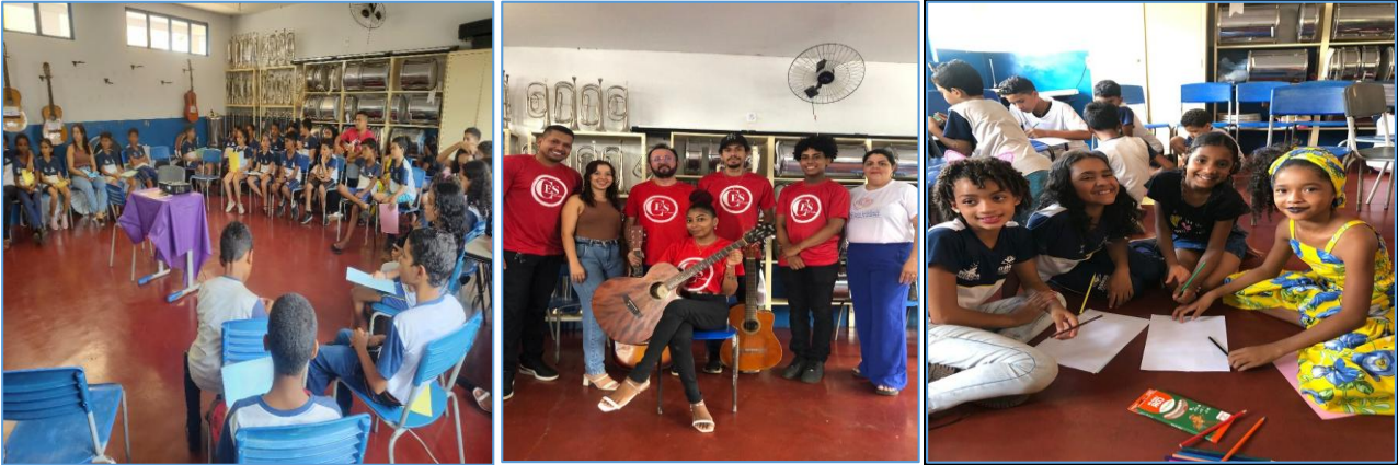
Figura 3 – Formação com crianças na Escola Municipal Nair Duarte