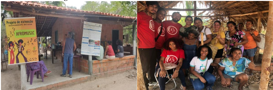
Figura 4 – Vivências em comunidades tradicionais

Por meio da figura 2, compreende-se que ações foram realizadas na Escola Municipal Nair Duarte, no dia 30 de setembro de 2024, com uso de música, literatura e desenho, no combate ao racismo. O trabalho antirracista com crianças envolve a promoção da igualdade racial e o combate ao racismo desde a infância, utilizando a arte como ferramenta principal. Isso inclui a valorização da diversidade étnico-racial, da autoestima de crianças negras e a conscientização sobre o racismo..