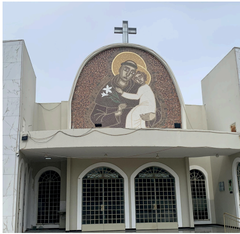
Figura 5 – Mosaico da Paróquia de Santo Antônio: a) Fotografia, b) Ícone.

visual. Além de embelezar a igreja, o mosaico reforça a presença do santo na vida da comunidade, tornando-se um ícone espiritual e um ponto de referência para fiéis e visitantes. Sua composição une valor artístico e significado religioso, dando vida e cor à arquitetura e fortalecendo a identidade da Paróquia. A Figura 5 apresenta a fotografia da paróquia e o ícone criado.