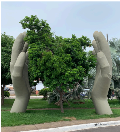
Figura 4 – Estátua das mãos: a) Fotografia, b) Ícone.

A escultura das mãos sustentando uma árvore de pau Brasil, próxima à rodoviária, simboliza proteção, cuidado e renovação ao unir elementos humanos e naturais. As mãos acolhem a árvore que brota de seu centro, representando a ligação entre o homem e a natureza. Escolhida como ícone pela mensagem de união e responsabilidade ambiental, a obra oferece, em um ponto de passagem, um momento de reflexão sobre a importância de preservar e fazer crescer a vida. Simples na forma e profunda no significado, marca quem a observa pela força visual e simbólica. A Figura 4 mostra a fotografia registrada e o ícone produzido.