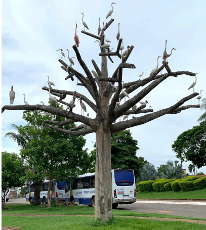
Figura 3 – Árvore com esculturas de pássaros: a) Fotografia, b) Ícone.

oferecer um momento de beleza e contemplação em meio ao fluxo cotidiano, a obra dialoga com o movimento constante do local, refletindo a vitalidade e o ciclo da própria natureza. A Figura 3 apresenta a imagem registrada e o ícone produzido.