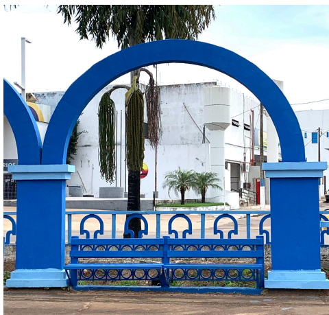
Figura 2 - Guarda-corpo e Arcos no Córrego Mutuca: a) Fotografia, b) Ícone.

O guarda-corpo e os arcos presentes no córrego Mutuca são elementos que se destacam por sua estética visual e funcionalidade. As formas geométricas dos arcos, associadas ao design do guarda-corpo, criam um contraste harmônico com o ambiente natural ao redor, evidenciando a relação entre a arquitetura e a paisagem. Este lugar foi escolhido como ícone devido à sua beleza marcante e à representação da integração entre design humano e natureza. A Figura 2 apresenta a imagem registrada e o ícone produzido.