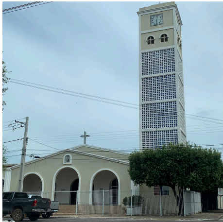
Figura 1 - Paróquia Nossa Senhora da Abadia: a) Fotografia, b) Ícone.

impacto visual significativo, reforçando a importância histórica e cultural do local. A escolha desse lugar se deu pelo seu papel como símbolo espiritual e comunitário, além de sua estética atemporal, que transmite serenidade e grandiosidade. A Figura 1 apresenta a fotografia do local e o ícone produzido a partir dela.