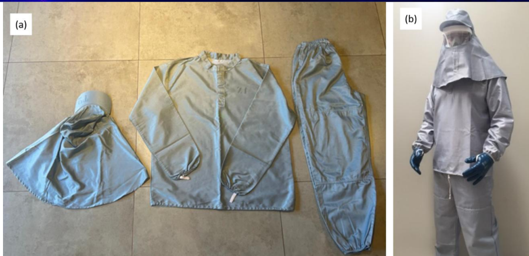
Figura 1 - Equipamento de Proteção Individual: (a) uniforme destinado como resíduo comum após o uso; (b) uniforme da empresa fabricante.

A Figura 2 mostra um fluxograma com todas as etapas experimentais a serem realizadas nesta investigação.