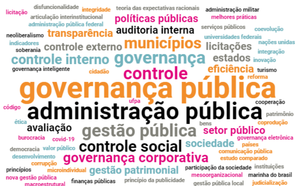
Figura 1 – Nuvem de palavras sobre o tema Governança Pública

Outro ponto analisado nos trabalhos selecionados foi a recorrência de palavras-chave contidas nos resumos dos artigos científicos. As palavras mais destacadas incluem "governança pública", "administração pública", "gestão pública", "controle", "governança corporativa", "políticas públicas", "transparência", "controle externo", "controle social", entre outras.