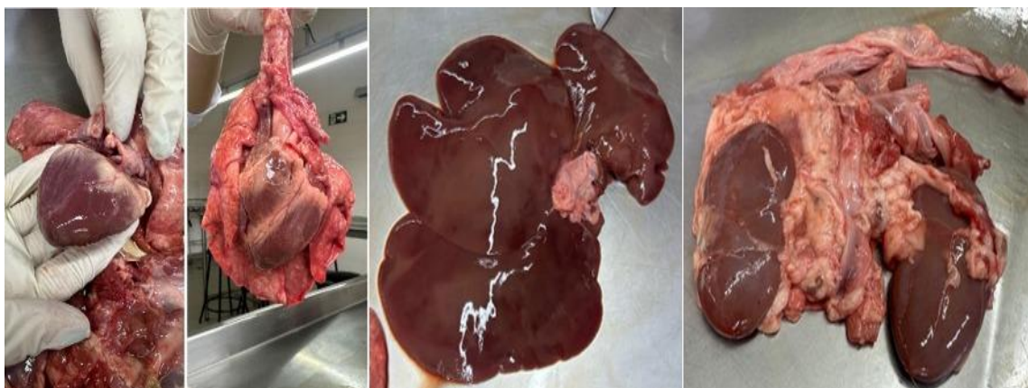
Figura 1: Coração, fígado e rins de suíno antes da limpeza.

Corações suínos frescos e íntegros foram previamente coletados e submetidos à etapa inicial de preparo, conforme ilustrado nas Figuras 1 e 2. Os órgãos passaram por limpeza criteriosa, com remoção de estruturas adjacentes — como rins, fígado e pulmões — além da retirada da gordura externa, deixando as peças aptas para o início do processo de congelamento e conservação.