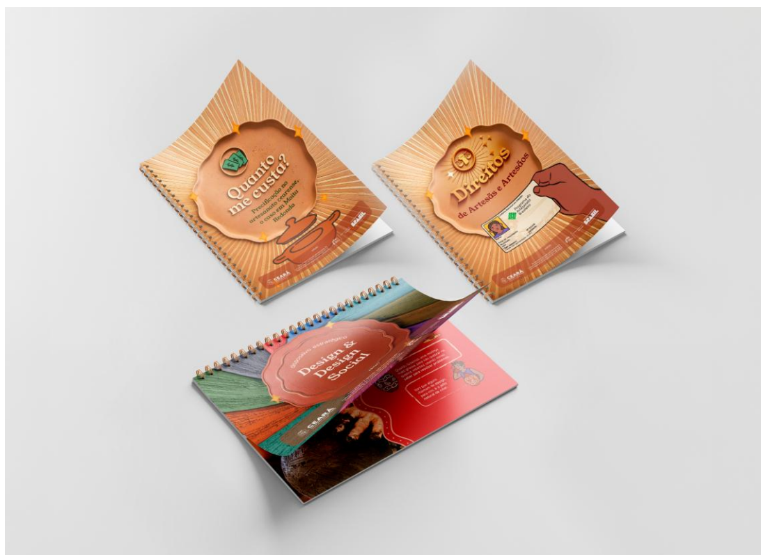
Imagem 5 – Capas das versões finais dos livretos