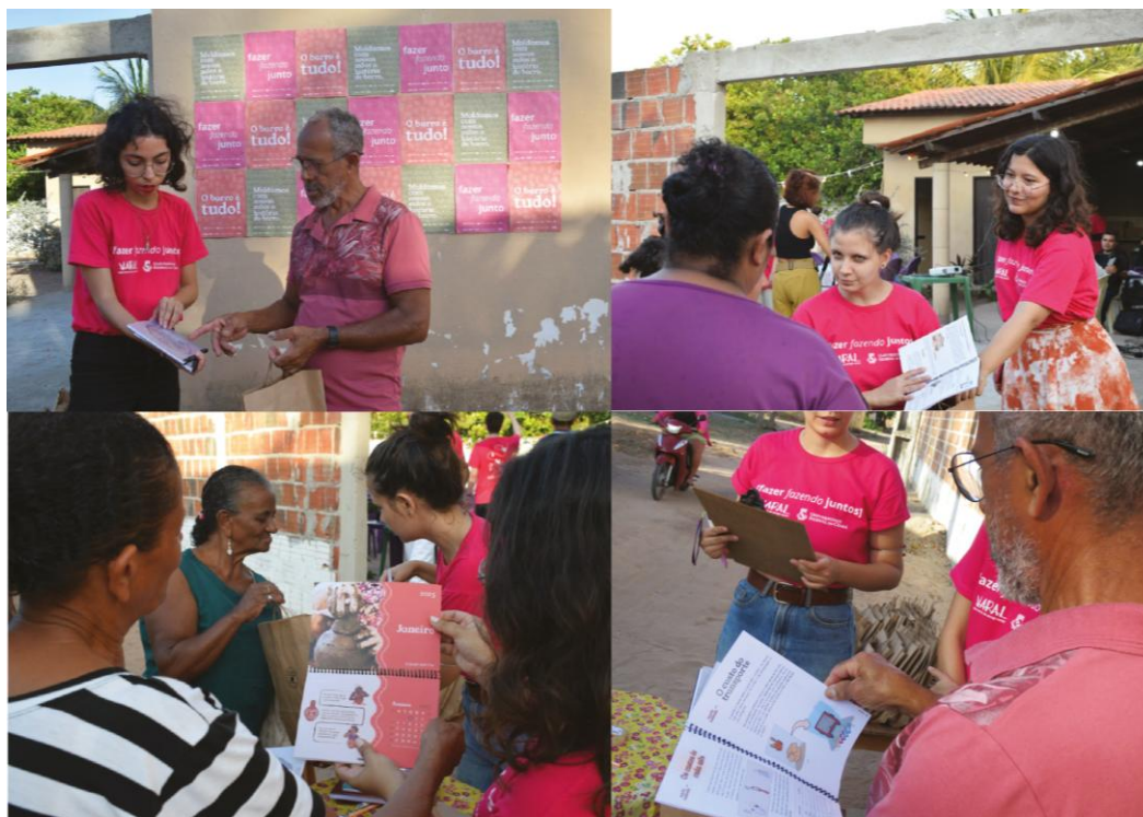
Imagem 7 - Entrega dos livretos finais na comunidade