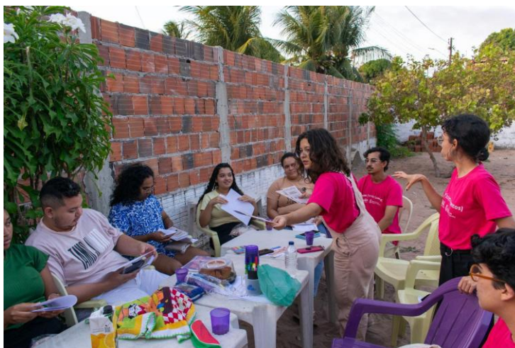
Imagem 1 – Reunião com a monitoria comunitária

Foram realizadas oito pesquisas de campo com ações para o desenvolvimento deste projeto, entre os meses de setembro e dezembro de 2024. A coleta dos dados foi feita tanto pela equipe interna quanto pelos monitores comunitários, seis jovens de Moita Redonda, entre 18 e 30 anos, que atuam como auxiliares no processo de acabamento das peças artesanais dos núcleos produtores (pintando, alisando, queimando etc). Os monitores participaram de processo seletivo para contribuir com o projeto e produziram fotos, vídeos e entrevistas, além de facilitar a comunicação com a comunidade de modo geral durante as idas de campo e os períodos entre idas.