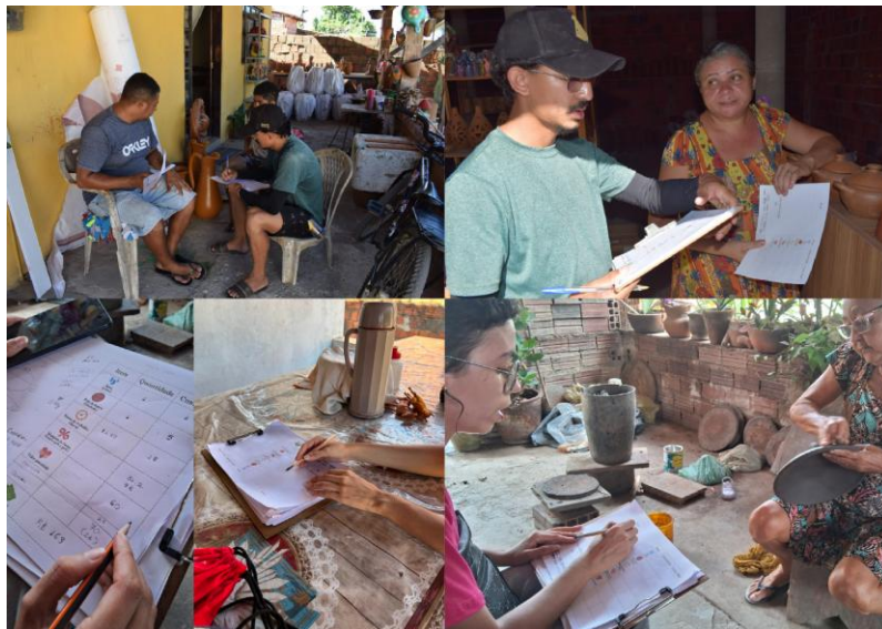
Imagem 2 – Testagem de protótipos em campo

sobre a carteirinha de artesão e os passos para obtê-la. Ambos os materiais possuíam teor principalmente informativo, pouco interativo, e foram entregues a artesãos que haviam demonstrado dúvidas sobre a temática. O panfleto foi distribuído e mediado pela equipe interna e a cartilha, pelos monitores comunitários.