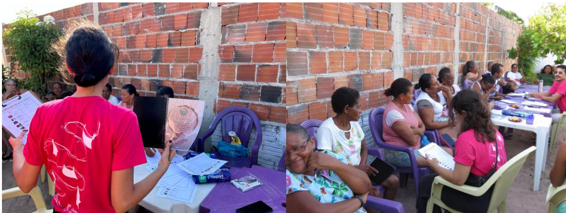
Imagens 3 e 4 – Apreciação dos livretos em Oficina Criativa

Com as críticas incorporadas, os Guias ilustrados para comunidades artesanãs: direitos, precificação e design social foram distribuídos na forma impressa para cada núcleo produtor e disponibilizados digitalmente, permitindo apropriação por outras realidades do artesanato popular. Os dispositivos estratégicos contêm linguagem simples, ilustrações, quadrinhos e interações analógicas que reforçam a participação do público. No livreto de Precificação, há espaços para preenchimento a lápis, facilitando o uso da ficha como instrumento de trabalho; no guia de Direitos, as listagens ilustradas de documentos e critérios também têm possibilidade de preenchimento, como checklists ; já o livreto de Design Social foi entregue à comunidade na forma de calendário, estimulando o uso cotidiano. A proposta incluiu versões audionarradas, com efeitos sonoros, assegurando maior acessibilidade. Essas versões são acessadas por meio de um QR code na versão impressa e um botão no e-book. Os materiais podem ser encontrados no link: https://linktr.ee/guiaseducativosartesanato .