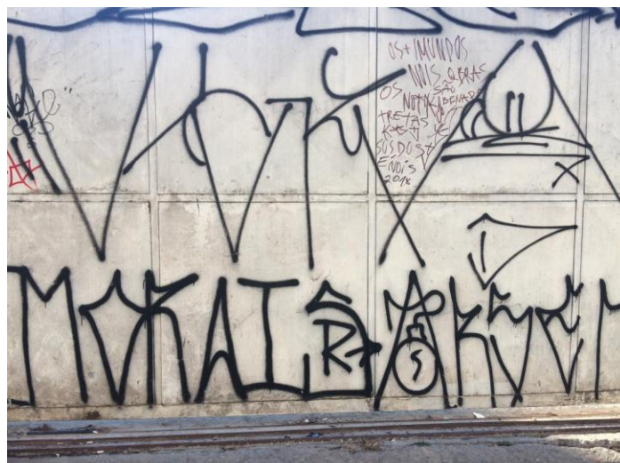
Figura 1 - Pixo Reto - São Paulo

Partindo para os atributos estéticos da pixação de MRGN, pode-se perceber que, ao longo de sua atuação dentro do movimento, sua tag passou por algumas modificações, em que se pode perceber forte relação com processos de construção tipográfica. Suas letras foram adquirindo uma maior complexidade e traços mais aglutinados, mas algumas das principais características foram mantidas, a exemplo da mescla de traços retos e curvos e a utilização de traços únicos e contínuos.