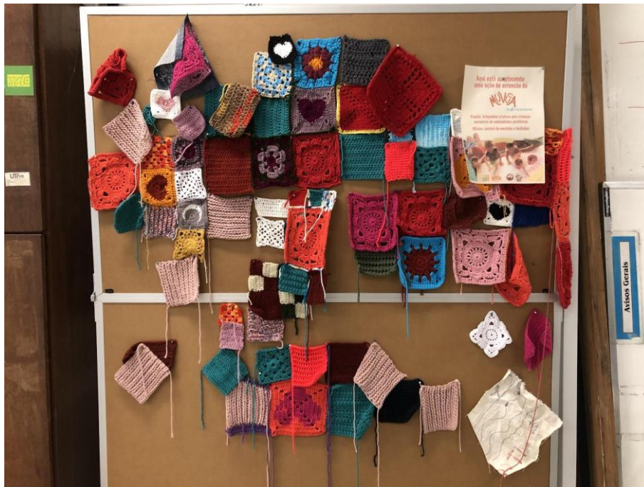
Imagem 8 – Mural com testes de crochê da disciplina “Projeto de Moda”.

Projetar um ambiente de aprendizagens coletivas para a UTFPR-CT, em diálogo com outros agentes da comunidade, foi um exercício de Design Prospectivo. O Ateliê de Moda se propôs a investigar a trajetória institucional e a satisfação dos estudantes, promovendo mudanças graduais e imediatas. Ao acolher as contradições do caminho, o projeto busca nos aproximar de futuros marcados por relações mais críticas, sustentáveis, solidárias, dialógicas — e, por que não, monstruosas — em resposta a um modo de estar no mundo e de educar-nos que é domesticado e insustentável.