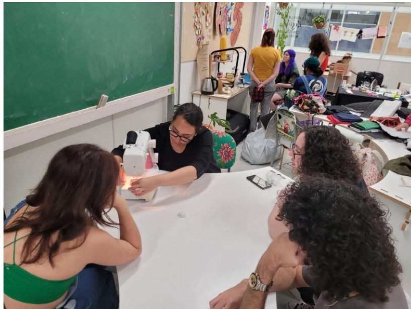
Imagem 3 – Oficina de costura com múltiplos educadores-educandos.

Ao longo de três semestres, reunimos um repertório de experiências como educadores-educandos, refletindo constantemente sobre “como são/seriam as infraestruturas construídas ao longo do caminho, como implementá-las e concretizá-las?”. Produzimos um sistema de design maleável e vivo, pelo caráter colaborativo. Estabelecer horizontalidade convida educadores e estudantes a compartilhar vivências, possibilitando reflexão crítica e resistência contra modos de pensar opressivos.