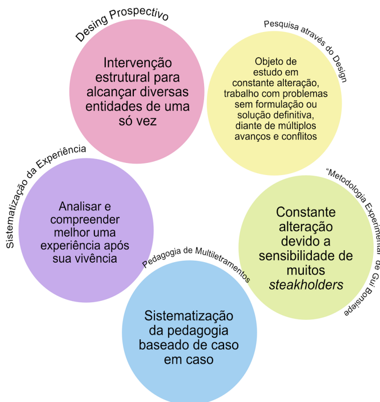
Imagem 2 – Qualidades da pesquisa.

No âmbito educacional, a pesquisa traz consigo o uso de métodos pedagógicos da Pedagogia de Multiletramentos, de Kope e Kalantzis (2007). Também conhecida como Learning by Design , ela categoriza epistemologias para processos de aprendizado, tornando possível um processo metódico, mas ainda flexível.