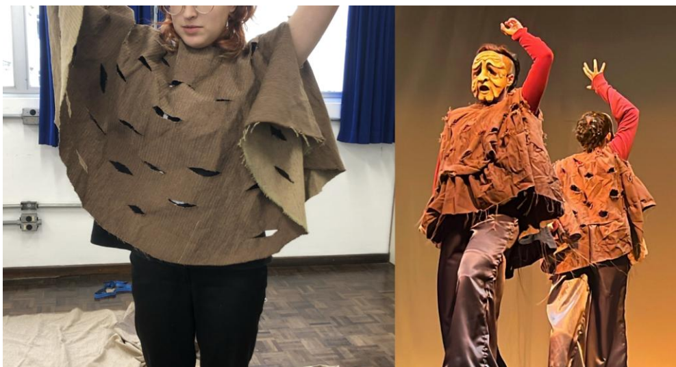
Imagem 5 – Produção e uso de figurinos na peça “Parte”.