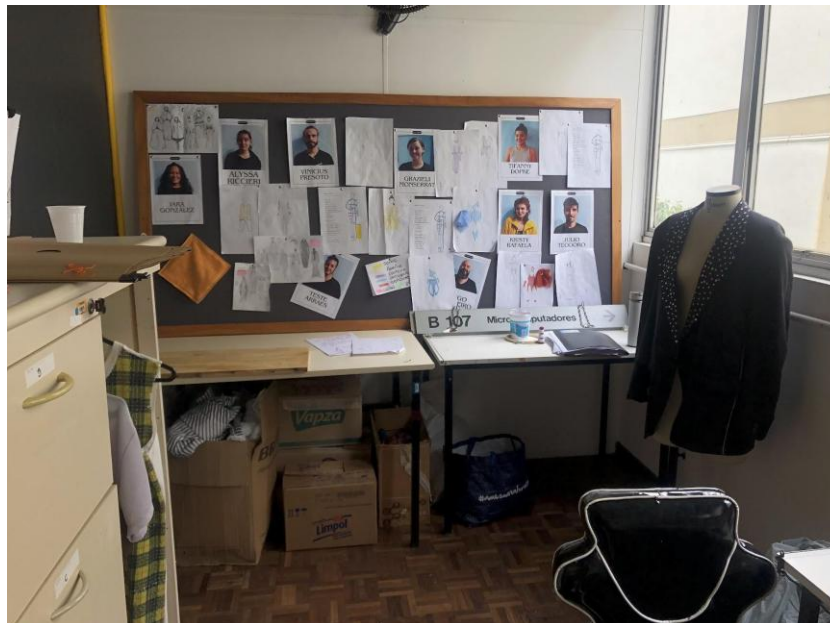
Imagem 4 – Mural sendo utilizado para desenvolvimento de figurinos.

A partir dessa abertura, o ateliê serviu como centro para várias atividades, incluindo: