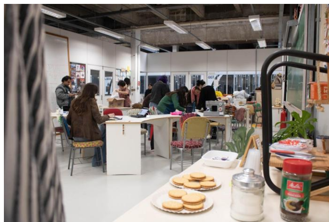
Imagem 7 – Oficina de Almofadas em Upcycling.

O aspecto mais marcante do processo foi a distância entre o desejo de liberdade e o condicionamento adquirido em experiências educativas anteriores. Mesmo diante da possibilidade de autonomia, muitos participantes hesitaram em agir, presos a paradigmas arraigados. No sistema capitalista, prevalece a dubiedade entre “não saber querer, só obedecer” e “querer, mas não agir”. Foi nesse contexto que se recorreu a ferramentas como o Learning by Design , buscando facilitar a transição de pedagogias tradicionais para abordagens mais libertadoras.