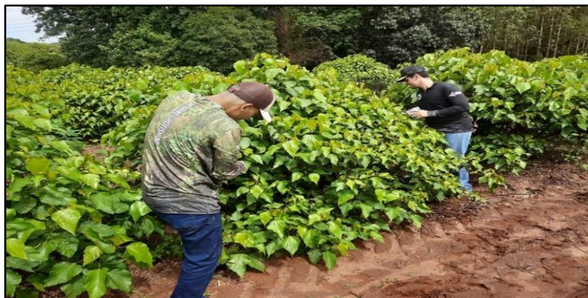
Figura 1: Aplicação dos fertilizantes na projeção da copa das plantas de urucum.

Portanto, o estudo constituiu-se da aplicação de doses variáveis de P_2O_5 (0, 25, 50, 100 e 200% da dose padrão de P_2O_5 ) que formaram os tratamentos, os quais foram repetidos quatros vezes. Desta maneira, o experimento foi em blocos inteiramente casualizados com cinco tratamentos e quatro repetições, totalizando vinte unidades experimentais. As adubações foram realizadas à lanço, em dose única, no início de novembro de 2024, na projeção da copa das plantas de urucum conforme recomendação da Embrapa (2021). A colheita da “safrinha” do urucum foi realizada no final do mês de fevereiro de 2025.