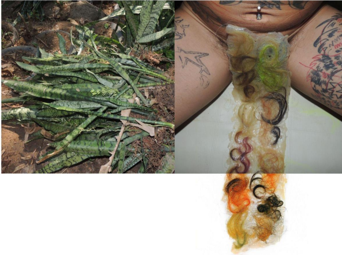
Imagem 1 - [ árvore da vida], 2024. fotoperformance.

[ árvore da vida ] é uma fotoperformance realizada durante a residência imersiva Lab Corpo BXD, em 2024. A composição em corpo único de dois pólos busca criar uma continuidade entre um manejo de uma barreira de espadas de Ogum no território Casa Autônoma Formiga Preta no Complexo do Alemão, usadas para preservar o território controlando incêndio e uma imagem onde uma pele feita com látex e cabelos, meus e de diferentes pessoas que os doaram, de diversos anos, é colocada sobre o corpo, criando uma forma fálica.