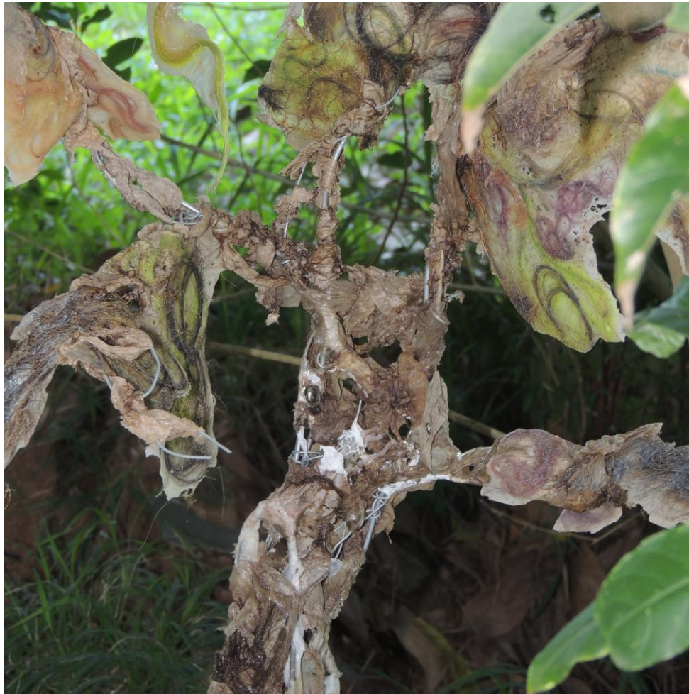
Imagem 3 – detalhes de [ encantado ]. vaso de barro, concreto, terra, arames, plástico, látex e cabelos variados de participantes e de vega de diferentes anos, 2024.

Na série de Cadernos Selvagens “Corpo-território” que é fruto de um curso oferecido pela curadora, pesquisadora e ativista Sandra Benites Guarani Nhandeva, a história de Nhanderu e Nhandesy é narrada e serve de base para desdobrar questões sobre o corpo, o cuidado e o “teko” ou forma de viver Guarani. A pesquisadora conta que essa história foi muito marcante, pois sua avó contava dando muita ênfase na perspectiva de Nhandesy, que nessa narrativa é incorporação da própria terra, do chão em que pisamos. Ela conta como Nhandesy é da terra e Nhanderu é do céu, e que Nhanderu abandona Nhandesy, grávida do Sol e da Lua, que se sente perdida e solitária. É um mito que nos lembra de valorizar a terra, a nossa base e que no primeiro Caderno desse ciclo,