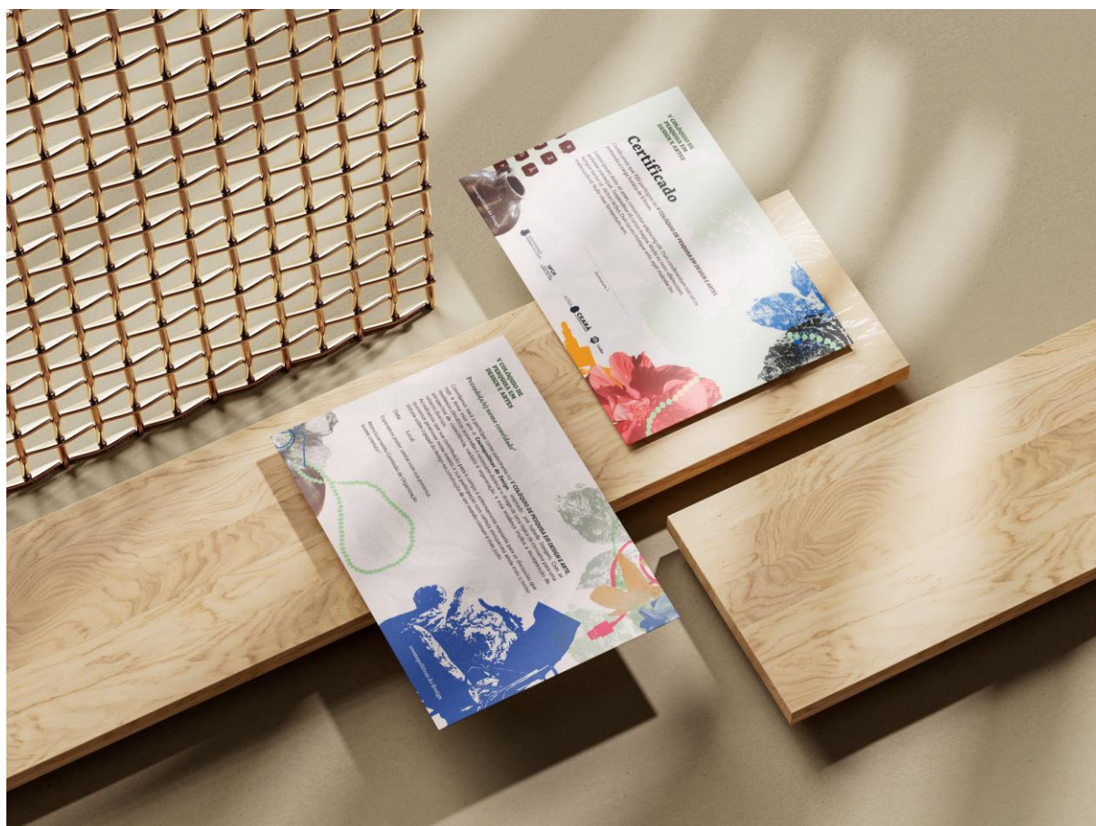
Imagem 1 – Mockup peças gráficas: V CPDA