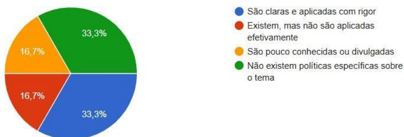
Gráfico 2: Aplicação de políticas institucionais para prevenção de assédio

A formação preventiva sobre riscos ocupacionais não foi oferecida a nenhum docente. Metade manifestou interesse, mas relatou nunca ter tido oportunidade de participar. No que se refere ao enfrentamento do assédio moral, os dados indicam fragilidade institucional: 33,3% percebem a existência de políticas claras, enquanto os demais relatam falhas de implementação, insuficiência de divulgação ou ausência completa de políticas (Gráfico 2). A percepção de segurança interna também é parcial: apenas 16,7% a consideram eficaz, enquanto 83,3% indicam falhas no monitoramento.