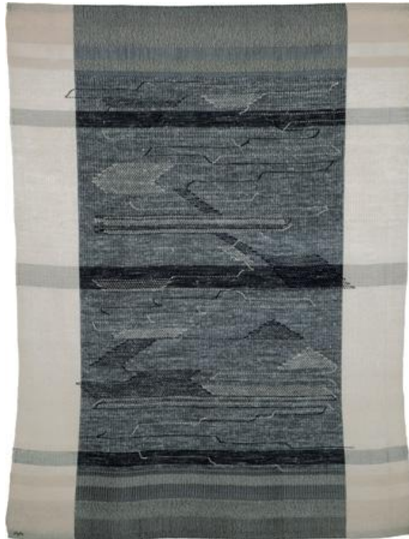
Imagem 1 – Monte Alban , tecelagem pictórica. Anni Albers, 1936. Fonte: Weber, p. 42 (2009).