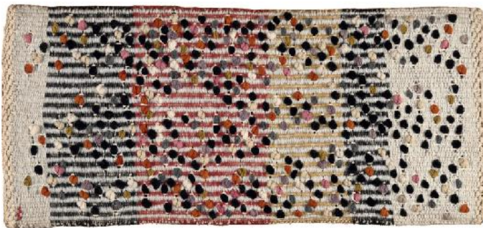
Imagem 2 – Pontilhado , tecelagem pictórica. Anni Albers, 1959.